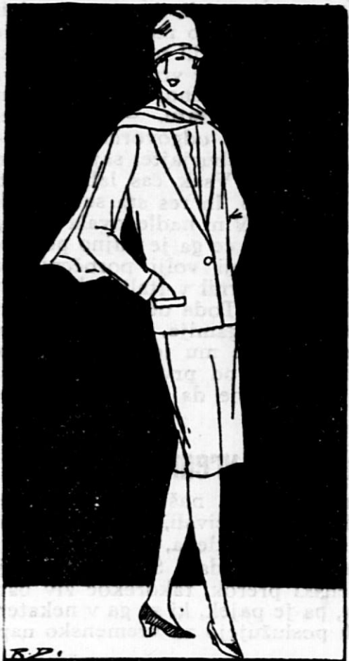
Elegantna promenadna obleka.