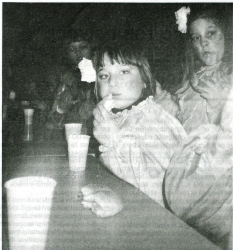
Nas bo tudi letos obiskal dedek Mraz?