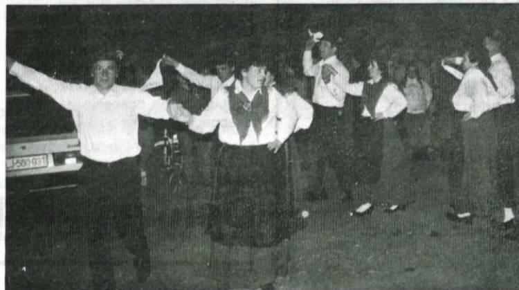
Folklorna skupina Trate je 8. februarja nastopila v Logatcu

zaradi svoje iznajdljivosti, pa tudi pripravljenosti pomagati s prostovoljnim delom pri razvoju krajevnih skupnosti. Ko pa se približa zimski čas, se mladi zberejo na odru v osnovni šoli. Začnejo se vaje. Tako je bilo tudi letos. Zima brez snega in mraza je marsikateremu olajšala pot na vaje. Na gledaliških deskah je oživela zgodba neznanega avtorja Kdo bo dededič , ki so jo vrhovski gledališčniki premierno uprizorili 19. februarja. Pod režijskim vodstvom Francija Jereba pripravljajo še eno premiero. To bo Veseli večer, kate-