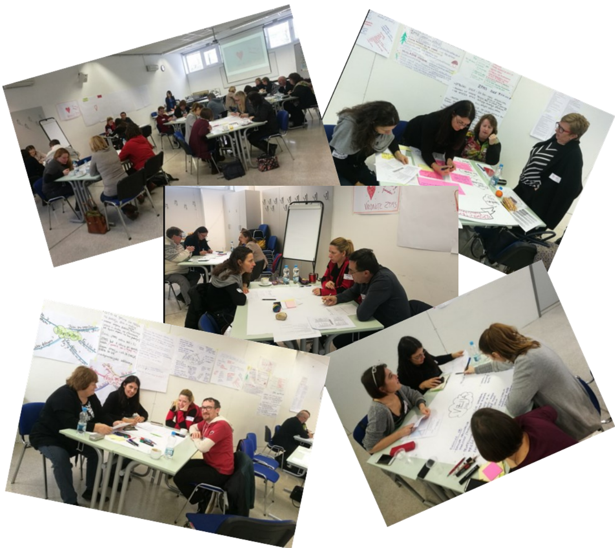
Aktivno delo udeležencev posveta.