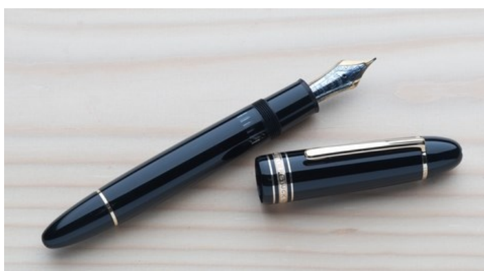
Črno-zlato nalivno pero Mont Blanc.