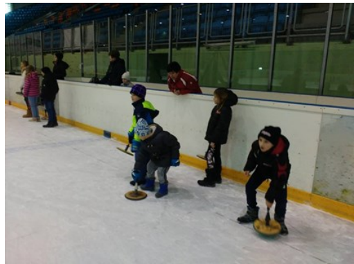
Prvi poskusi v kegljanju na ledu.

Od 26. februarja do 2. marca potekajo v naši regiji zimske počitnice. Pripravili smo gibalne delavnice (kegljanje na ledu, bridž, namizni tenis, drsanje na trgu, tekmovanje s pležuhi) in ustvarjalne delavnice (recikliramo, "pležuhova" delavnica, kvačkaj in nakvačkaj, čarobni otroci) ter zimski sredin izlet. Vse dejavnosti, razen sredinega izleta, so bile brezplačne.