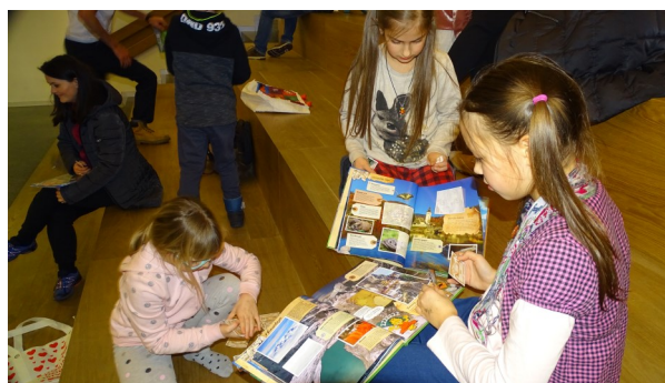
V slogi je moč.

Društvo je že dalj časa odprto za ideje in potrebe iz lokalnega okolja, zato je na pobudo članov organiziralo prvo menjavo sličic. Tokrat so bile v ospredju nalepke Goremania, katere smo zbiralci z navdušenjem menjavali. Iz tovrstnih albumov se lahko naši otroci marsikaj naučijo o živalih, rastlinah, gorah in drugih zanimivostih. Približno petdeset otrok in staršev je navdušeno odšlo domov z nekaj bolj napolnjenimi albumi in kupčki podvojenih sličic.