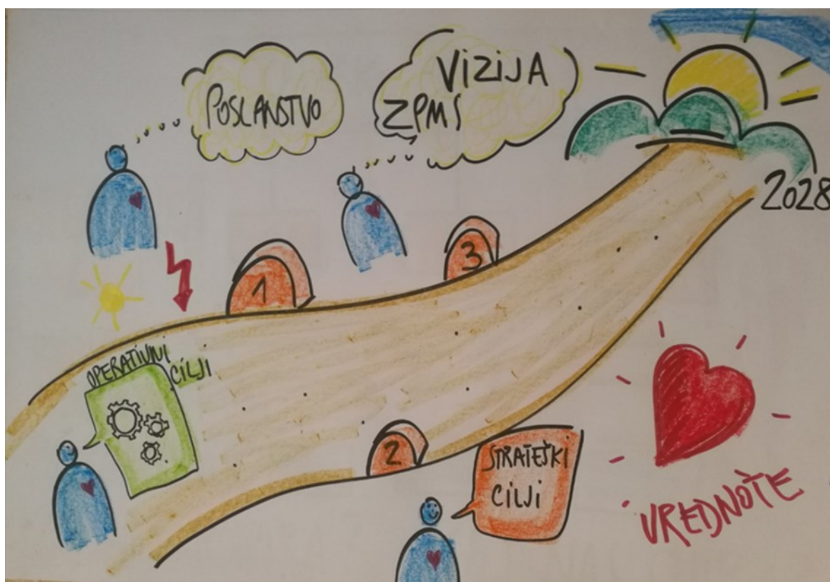
Načrt dela posveta.

Delo v zvezi s strategijo se bo nadaljevalo na regijskih posvetih.