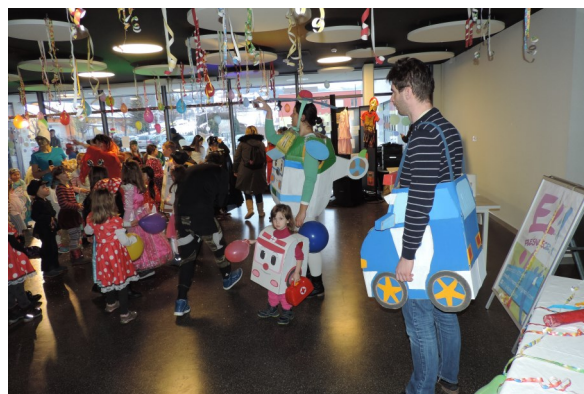
Atraktivni doma izdelani pustni kostumi

Na sončno nedeljo smo izvedli že četrto zaporedno pustno povorko. Radožive pustne šeme so pred vrtcem na Lavrici oblikovale dolgo pisano povorko s krepko preko 100 mladimi maškarami v spremstvu staršev ter se sprehodile skozi naselje Ob potoku. Dogajanje so tudi letos popestrile maškare na islandskih konjih z Orli.