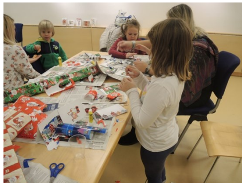
Decembrska ustvarjalna delavnica.

Za najmlajše in šolarje iz socialno šibkih družin se je ob koncu leta končalo kar nekaj dobrodelnih projektov. Tako je ZPM Domžale v sodelovanju z ZPMS v okviru projekta Alpine »Podari svoj par« prejela blizu 200 parov obutve, ki so bili razdeljeni med otroke, copati tudi med vrtce, nekaj parov pa svojega lastnika še čaka.