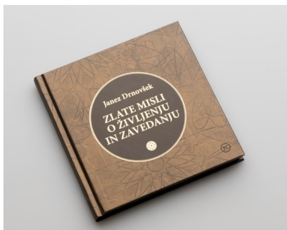
Knjiga Zlate misli o življenju in zavedanju.