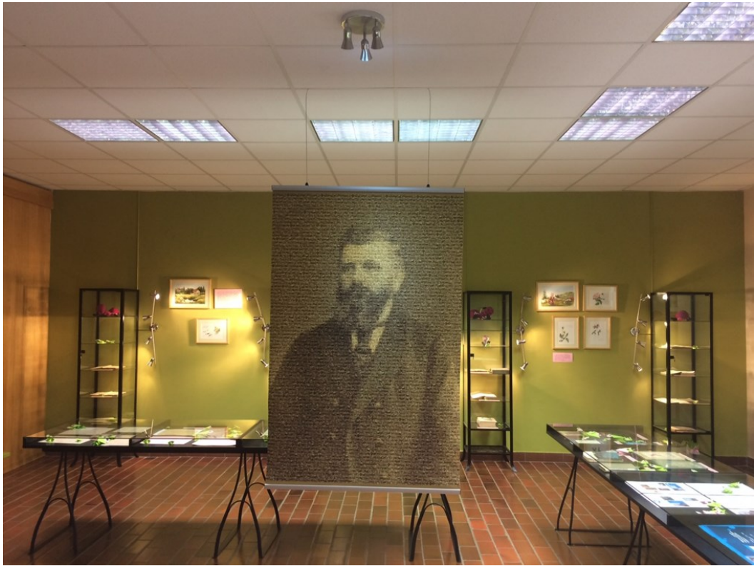
Spominska soba Frana Erjavca.