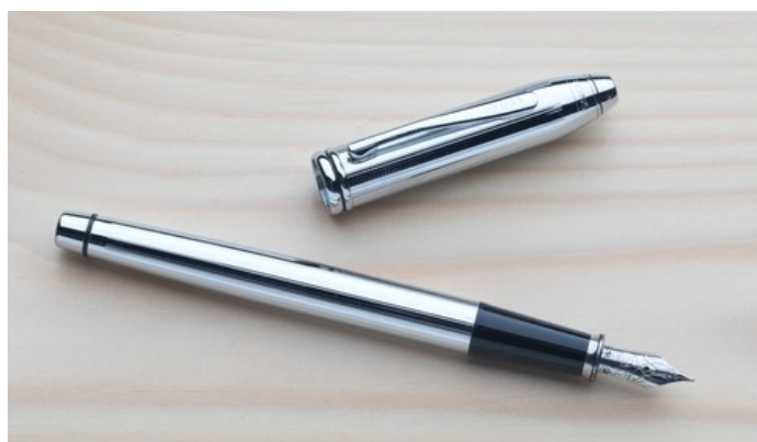
Srebrno nalivno pero.