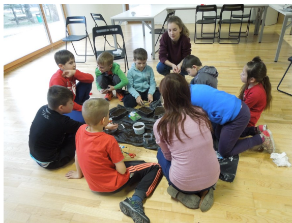
Sejanje zeliščnih lončkov.

V letošnjem letu se je zima v pravem pomenu besede pokazala tudi v Vipavski dolini in to prav med zimskimi počitnicami, ki so za otroke zahodne Slovenije potekale med 19. in 23. februarjem. V MDPM Ajdovščina smo v sodelovanju z Mladinskim centrom v Hiši mladih v Ajdovščini pripravili celodnevno varstvo z ustvarjalnimi delavnicami, izlet v Atlantis in Kolosej, z dvema delavnicama pa smo obiskali tudi otroke v Lokavcu in Dolgi Poljani. V času zimskih počitnic se je 11 otrok iz naših občin udeležilo še humanitarnega zimovanja v domu ZLRO v Gozd-u Martuljku, ki smo jih organizirali v sodelovanju z ZPMS.