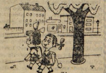
Kar verjemi mi, za uspeh v življenju je zunanji izgled veliko bolj važen kot šolsko spričevalo.