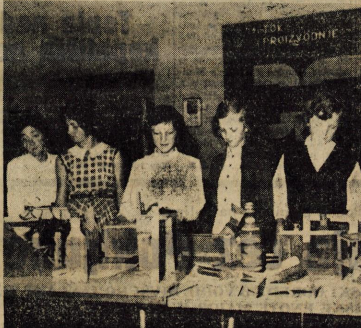
JESENICE, 26. junija - Včeraj popoldne so v pritiščju osnovne šole 'Prežihov Voranc' zaprili razstavo tehničnih in likovnih izdelkov...