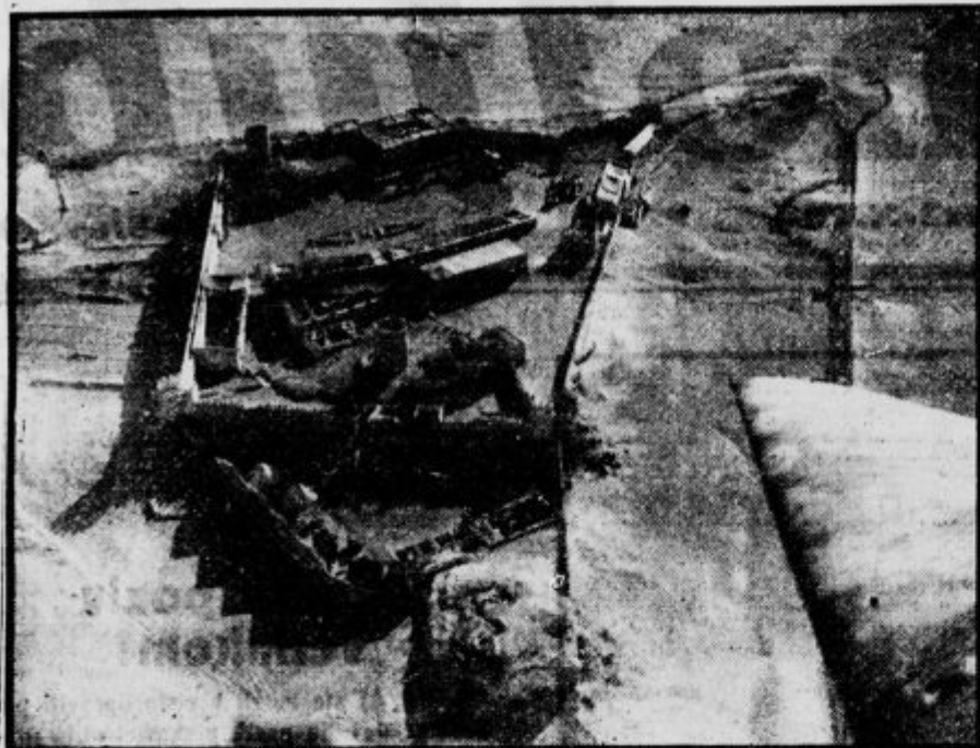
Trdnjava Džarabub. — Pogled nanjo z letala.