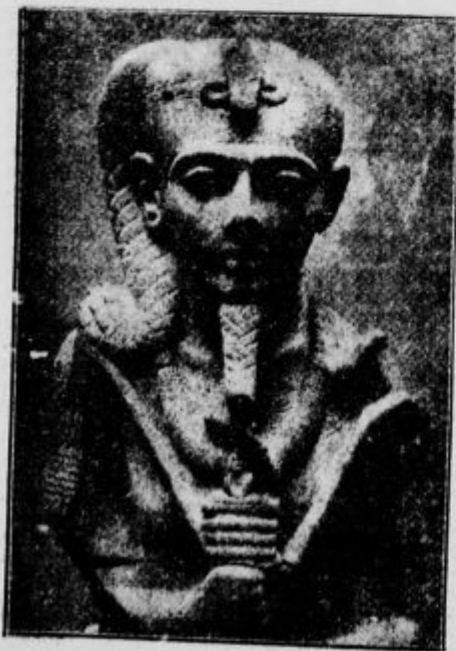
Starodaven egiptski vladar faron