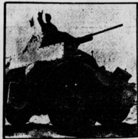
Na egiptski fronti: Poveljnik italijanske ogledniške patrolje v oklepem avtomobilu daje znamenje za odhod.

Nemška oblastva so delno ukinita prometne omejitve v deželah pod nemško zasedbo.