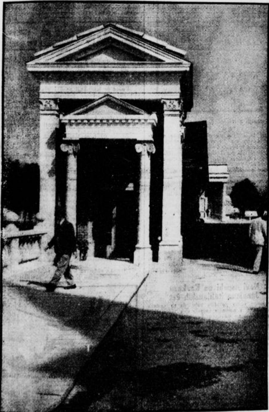
Pogled na nove ljubljanske tržnice