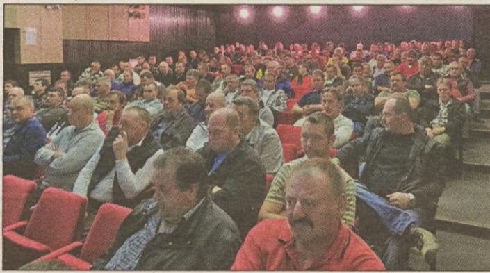
Redno usposabljanje voznikov za EU kodo v Domu na Vidmu.

Nov zakon je bil objavljen v Ur. listu RS, št. 57 dne 27.07.2012. Po doslej veljavnem zakonu je bil določen najdaljši plačilni rok 120 dni, po novem pa je ta rok lahko tudi daljši, če se tako pisno sporazumeta stranki. Še naprej pa velja, da v kolikor plačilni rok ni dogovorjen, velja zanj 30 dnevni rok. Še naprej velja obvezni pobot, s tem, da se po novem v obvezni pobot vpišejo obveznosti, ki so zapadle v mesecu pred mesecem pobota. Obvezni pobot pa ne velja za obveznosti, ki so zavarovane z instrumenti za zavarovanje plačil, obveznosti, ki ne presegajo 250,00 EUR, obveznosti do povezanosti družb, v primeru, če je upnik prenesel obveznost na osebo, ki opravlja odkup terjatev v povezavi s svojo glavno dejavnostjo, v primeru, če poteka v zvezi s tem spor pri sodišču ali bo obveznost prenehala v skladu z vnaprej dogovorjeno verižno kompenzacijo ali pisnim dogovorom med dolžnikom in upnikom.