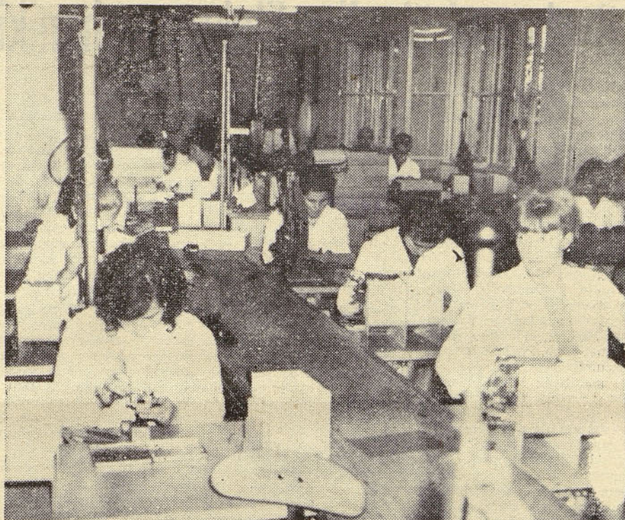
Posnetek je iz našega obrata v Dobropolju in prikazuje delavke, ki na traku montirajo zaščitni rele RB-2

Solski center združenega podjetja Iskra Kranj bo pričel z izvedbo seminarjev takoj po prejemu prijav udeležencev.