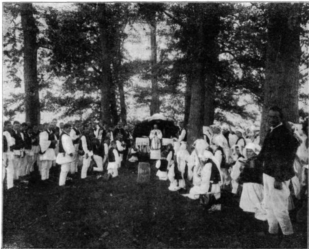
V Bosni: Sv. maša na prostem v šumi.

Vodstvo pogrebne bratovščine sv. Jožefa v Ljubljani naznanja svojim članom, ki so pristopili k isti letos ter so prejeli samo potrdila ali stare knjižice, da so nova pravila od c. kr. deželnega predsedstva odobrena ter so ravnokar v tisku. Nove društvene knjižice s pomenljivo sliko (smrt sv. Jožefa) se bodo