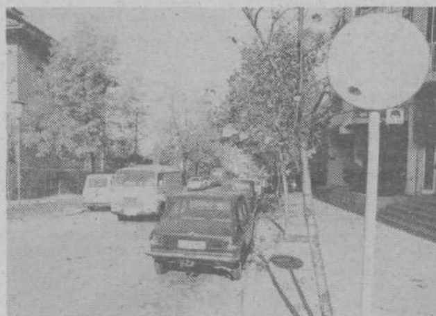
Enako velja za voznike osebnih avtomobilov pred gostilno Fortuna, le da tam mnogi parkirajo celo po pločnikih.