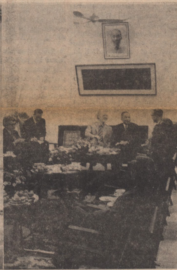
SESTANEK V SEVERNEM VIETNAMU

skih pripravah, zvezanih z nevesočnostmi, kot sestredensko uporabljanje tablet proti malariji ter dvakratno cepljenje proti kugi, pegastemu legarju, polio, črne kože in gama globulin za delo, smo odpotovali iz Ottawa, dopoldne 13. marca. Z Boeing 707 kanadske vojske, smo poleteli preko Kanade v Anchorage, Alaska. Po kratkem oddihu smo potovanje takoj nadaljevali in v 6½ urah pristali v Tokyju na Japonskem, ki je bila že v spomladanskem z-