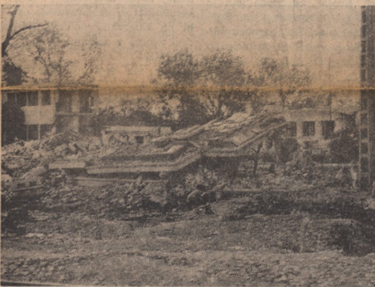
RAZBITA BOLNICA V HANOLU (N.V.) BOMBARDIRANO LANI DECEMBRA

Sodelavec našega lista je kot zastopnik kanadske etnične tiskovne federacije spremljal od 13.—18. marca letos kanadskega zunanjega ministra g. M. Sharpa na potovanju na daljni vzhod, kjer je slednji iskal dejstev za odločitev kanadske vlade za nadaljevanje članstva v mednarodni mirovni kontrolni komisiji (ICCS).