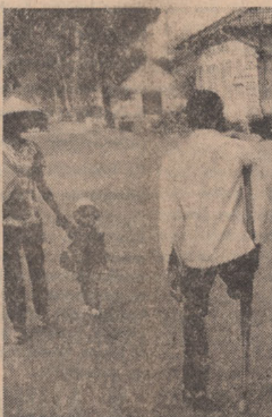
Pohabljenec v južnem Vietnamu