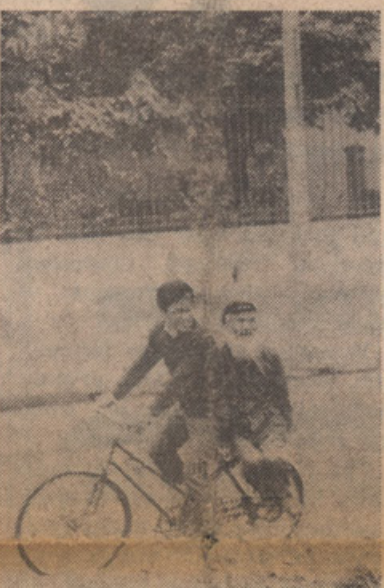
Oče in sin na kolesu v sev. Vietnamu

pal, kot tudi časopis "Slovenska Država", pisec tega poročila. Sest dnevni obisk je bil dukaj naporen, a pester in zanimiv. Obisk je bil poln političnih intrig v spretnih diplomatskih potezah. Po dveh tedenskih zdravni-