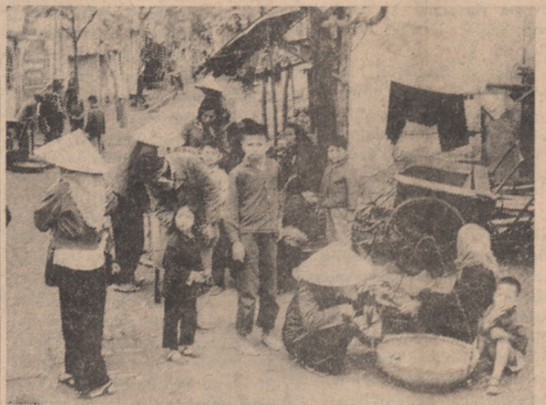
NA ULICI SAIGONA V JUZ. VIETNAMU

pal, kot tudi časopis "Slovenska Država", pisec tega poročila. Sest dnevni obisk je bil dukaj naporen, a pester in zanimiv. Obisk je bil poln političnih intrig v spretnih diplomatskih potezah. Po dveh tedenskih zdravni-