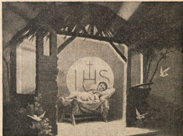
Božje Dete v jasliah

Uredništvo in Uprava želita srečno novo leto sotrudnikom in naročnikom „Cvetja“.