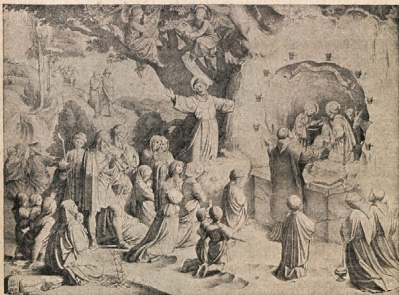
Sv. Frančišek in jaslice

Ker se torej življenje manjših bratov imenuje spokorno življenje, bi mogli misliti, da je spokorna pridiga bistveno propagandno sredstvo za širjenje novega reda. Da so torej bratje v svoji pridigi pred vsem delali na to, da bi poslušavce navdušili za enak asketični poklic, za vstop v novo redovno družbo. To je v resnici bilo zelo verjetno pri spokorni pridigi manjših bratov.