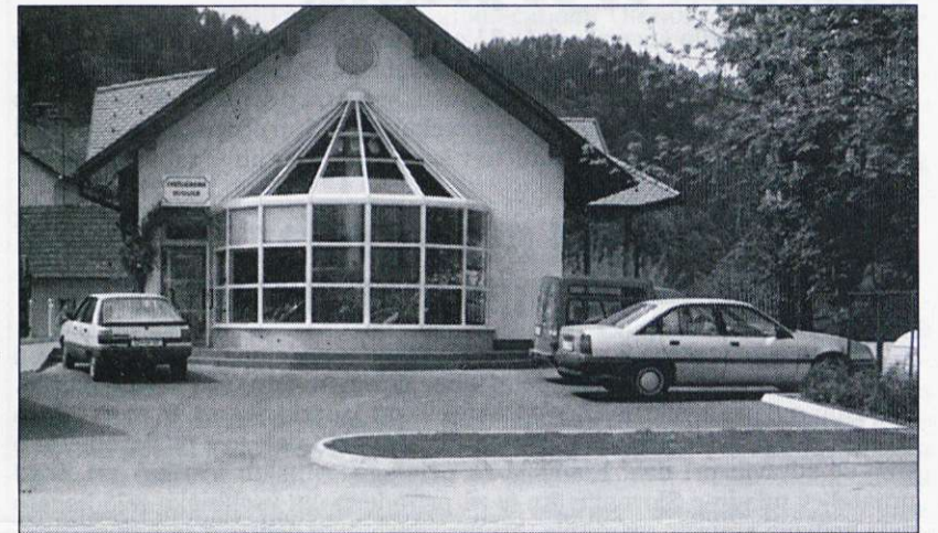
Cvetličarna "Vijolica" na Trgu svobode v Litiji