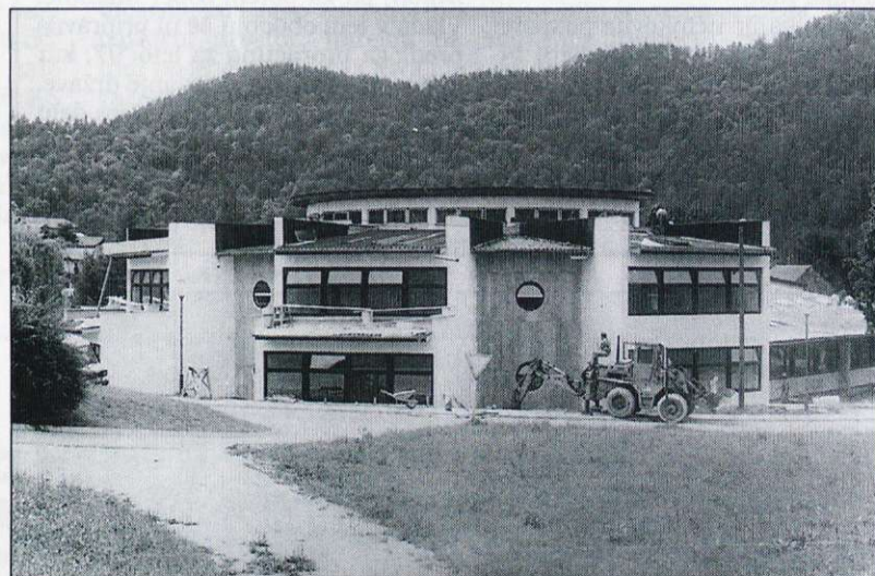
Pročelje nove gimnazije na Bevkovi ulici