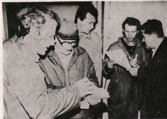
Na volišču 13. marca v TOZD Mehanizacija.

Dne 13. marca 1986 smo volili delegate za samoupravne organe v delovni organizaciji, v temeljnih organizacijah in v SOZD Giposs. Prav tako smo na ta dan volili delegate za 10 delegacij samoupravnih interesnih skupnosti in izvolili v te skupnosti 290 delegatov ter 142 delegatov za zbor združenega dela.