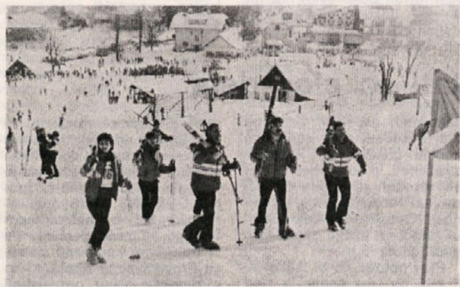
Veleslalomisti so se pred tekmo povzpeli peš ob progi