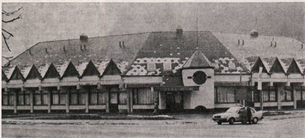
Novi hotel v Laškem za SOZD Merx. Izvajalec: TOZD GO Laško.