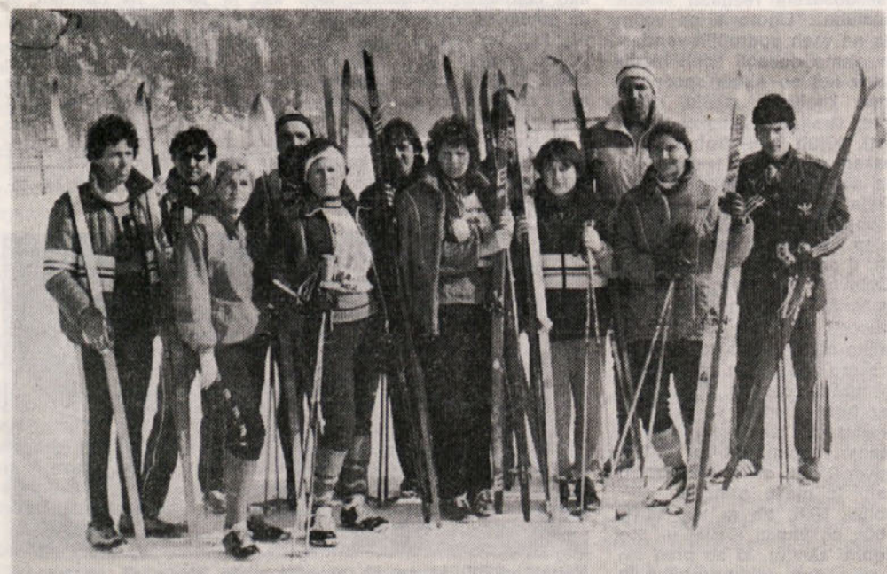
Ekipa naših tekačev po končani tekmi ŠIG v Kranjski gori.