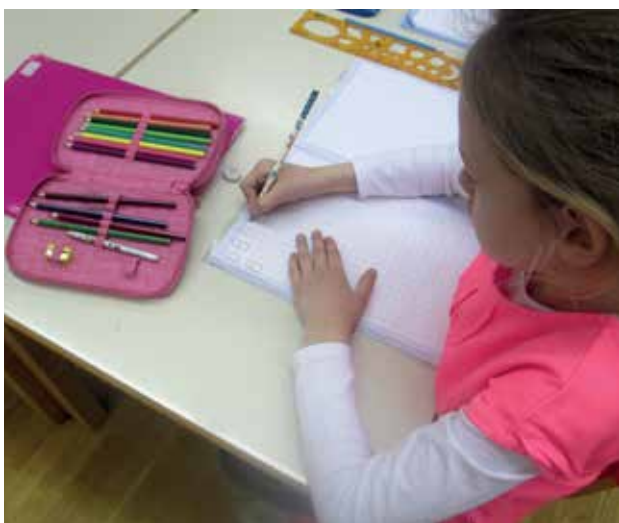
Slika 6: Zapis številke v zvezek.