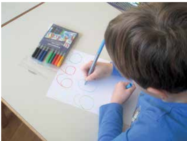
Slika 5: Zapis mavričnih števil.