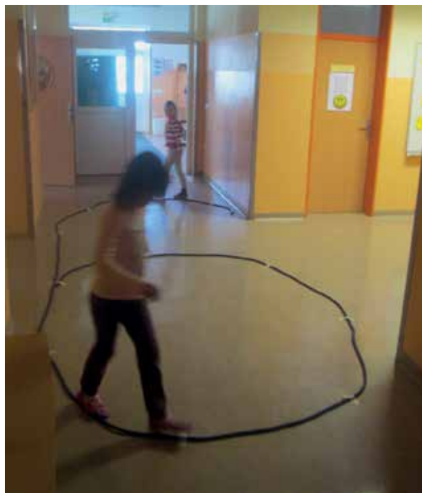
Slika 1: Hoja po vrvici v obliki številke.

Po motivacijski zgodbi učence povabim na sprehod po številki. Številko oblikujem z dolgo vrvico ali kolebnico