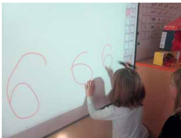
Slika 2: Zapis številke na interaktivni tabli.

na šolskem hodniku. Učenci hodijo po vrvici v obliki številke. Pazijo, da hodijo po številki v tisti smeri, kot številko tudi zapišemo. Najprej jim demonstriram, potem pa poskusijo še sami.