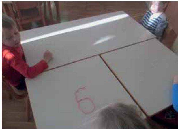
Slika 4: Oblikovanje številke iz vrvice.

Nato številke zapišemo s prstom po zraku. S prstom potujemo tudi po klopi v smeri številke. Najbolj žgečkljivo pa je, ko se z zapisom številke pobožamo po