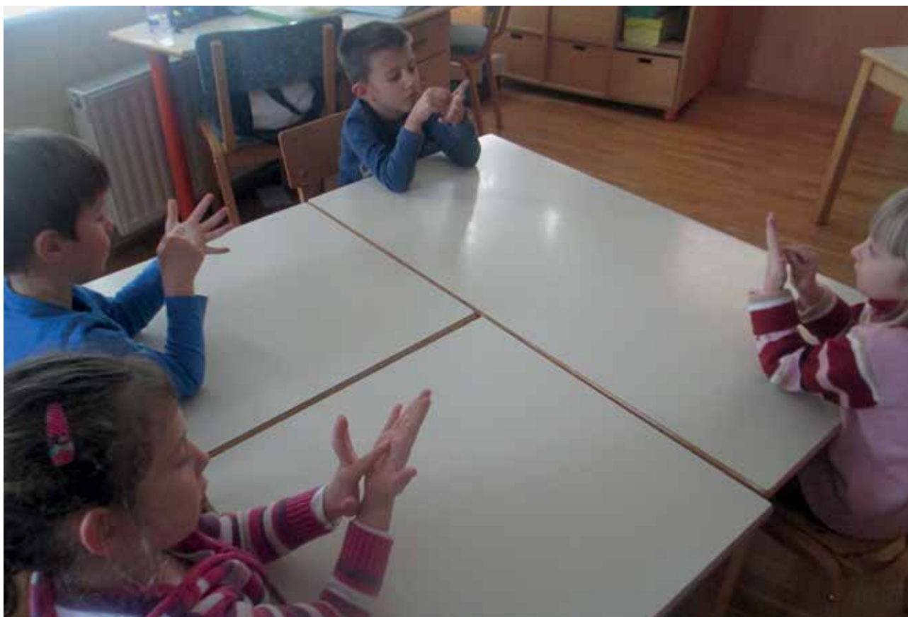
Slika 3: Zapis številke po dlani.

razumljivi. Zapis številke 6 pojasnim tako, da povem, da začnemo z lokom zgoraj, nadaljujemo v ovinek v desno ter zaključimo z večjim trebuščkom. Izrazi so zelo preprosti in učencem blizu, zato jih večkrat uporabim tudi pri zapisu drugih števil. Tudi pri številki 9 npr. uporabim izraz trebušček.