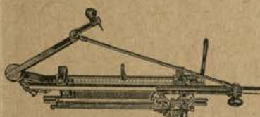
Najboljši švicarski pletilni stroj DUBIED