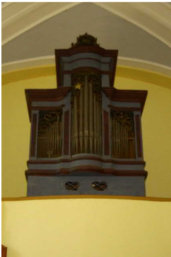
Slika 2. Gornja Petrička, orgle brez pedala leta 2016. (mđ)

kapela spada. 6 Imajo osem registrov; registrska in igralna traktura sta mehanski. V kapelo sv. Petra v Gornjo Petričko so bile premeščene pred prvo svetovno vojno, leta 1913, ko so bile za župnijsko cerkev v Samarici nabavljene nove orgle Antonina Mölzerja. Ladislav Šaban je ob pregledu leta 1972 zapisal, da so orgle bile v zelo slabem stanju. 7 Enako stanje smo ugotovili ob pregledu leta 2012 in 2021.