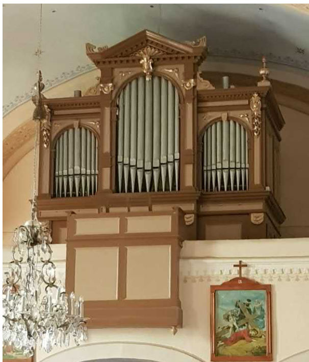
Slika 1. Bisag, orgle leta 2020. (mđ)