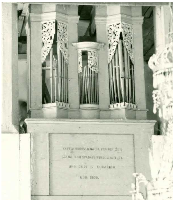
Slika 6. Trema, pozitiv leta 1972. (Nino Vranić)