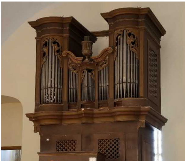
Slika 8. Veliko Trojstvo, orgle leta 2019. (mđ)