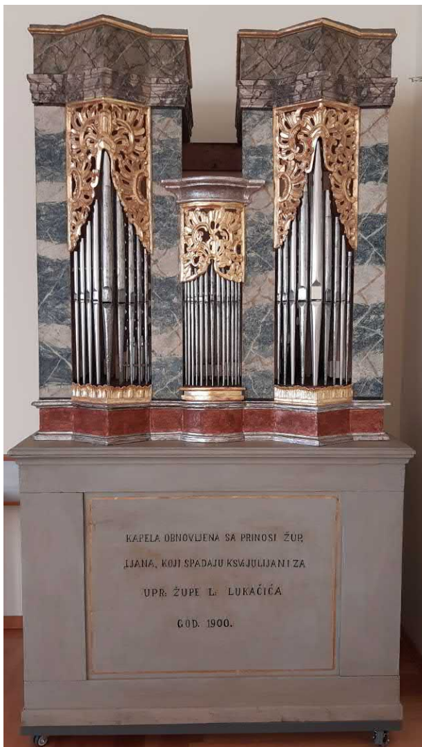
Slika 7. Trema/Bjelovar, pozitiv leta 2021. (mđ)