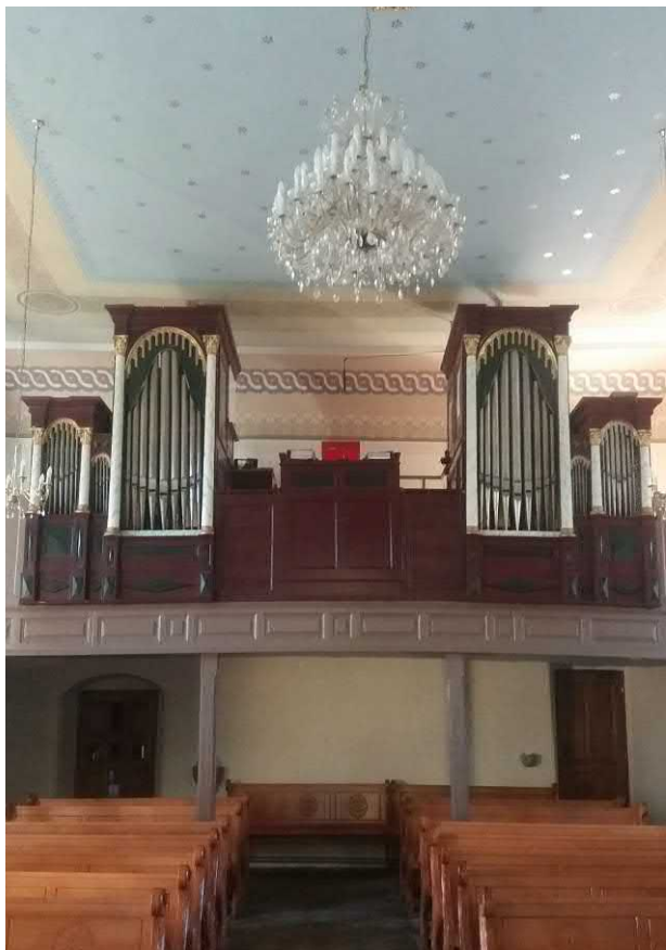
Slika 3. Gornja Rijeka, orgle.