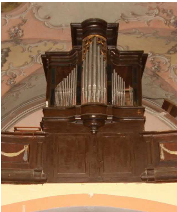
Slika 5. Hrašćina, orgle leta 2016. (mđ)