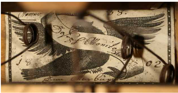
Slika 9. Veliko Trojstvo, podpis izdelovalca, leta 2019. (mđ)