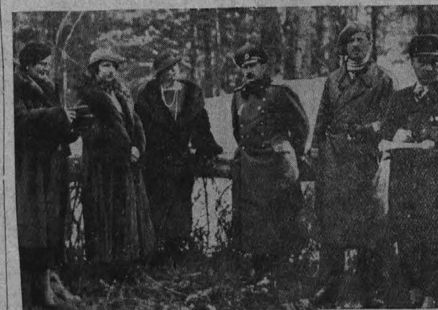
Bolgarska kraljevska dvojica se je mudila koncem januarja v Bukareštu in v Sinaji, na Ronunskem