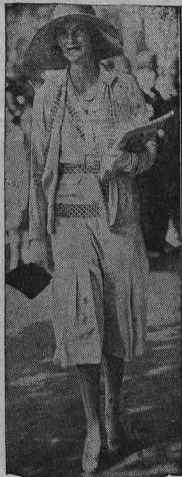
Doris Duke, kateri je njen oče, "kralj tobaka", zapustil 53 milijonov dolarjev