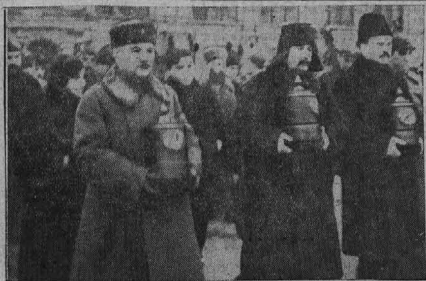
Voditelji ruskega naroda (v sredini Stalin) nosijo žare s pepelom ponesrečenih raziskovalcev stratosfere

V preteklih dneh je prišlo ob rusko-mandžurski meji do streljanja, ki je izzvalo proteste japonske vlade v Moskvi. Tokijo zahteva, naj ruska vlada kaznuje oficirje in vojake rdeče armade, ki so streljali ob meji na japonske letalce. To je seveda samo ena iskra, izmed mnogih. A ko bo priletela prava iskra v smodnikov sod, tedaj bo počilo.