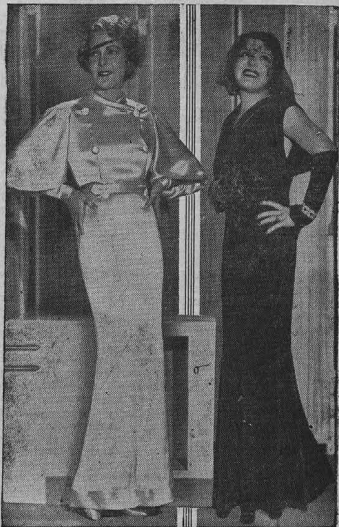
Dva modela elegantnih večernih oblek