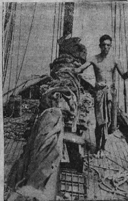
Francoz Alain Gerbault, ki že mnogo let sam potuje v svoji ladijci po svetu

84. obletnico svojega rojstva je obhajal preteklo sredo predsednik češkoslovaške republike Masaryk.