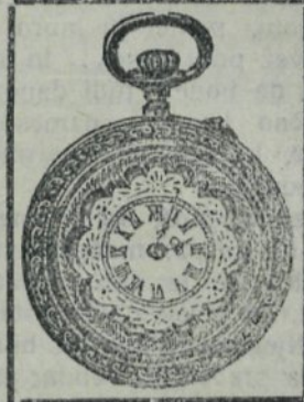
Ustanov. leta 1899.