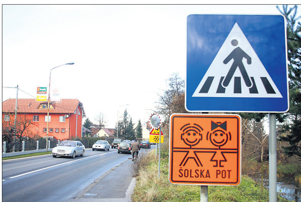
Ena najbolj obremenjenih mestnih vpadnic je Mariborska cesta.

Postavitev prometne signalizacije bo izvedena v okviru pristojnosti Direkcije Republike Slovenije za ceste za čas največ enega leta. Direkcija RS za ceste bo nemudoma pristopila tudi k pripravi predloga dopolnitve Pravilnika o omejitvi uporabe državnih cest za promet tovornih vozil, katerih največja dovoljena masa presega 7,5 tone, ki ga izda minister za promet. Po dogovoru s predstavniki ministrstva bodo pravilnik dopolnili tako, da bodo vanj vključeni vsi odseki cest, na katerih je Direkcija RS za ceste v okviru svojih pristojnosti omejila oziroma prepovedala promet za tovorna vozila z največjo dovoljeno maso nad 7,5 tone, glede na stanje cest pa je tako prepoved potrebno podaljšati za nedoločen čas.