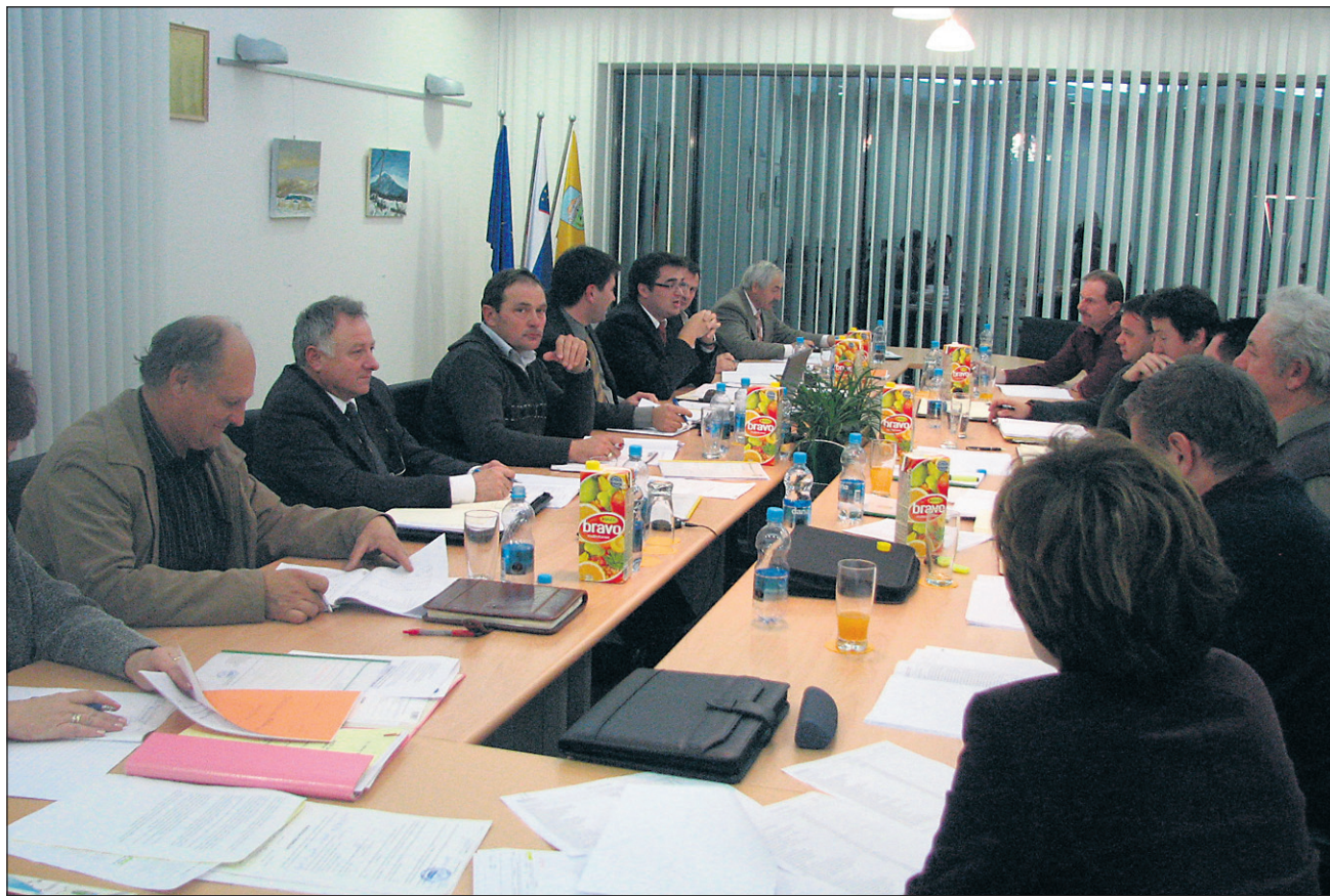
Dornavski svetniki so tokrat prekržali besede predvsem okoli denarja za gasilce: kaj, koliko, komu in zakaj ne, sprejeli pa so tudi nekaj zanimivih sklepov.