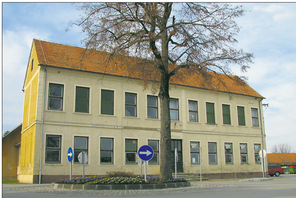
Na lokaciji sedanje zapuščene OŠ v centru občine naj bi v prihodnosti zgradili blok s 16 stanovanji, težavo pa naj bi predstavljalo premalo parkirišč.