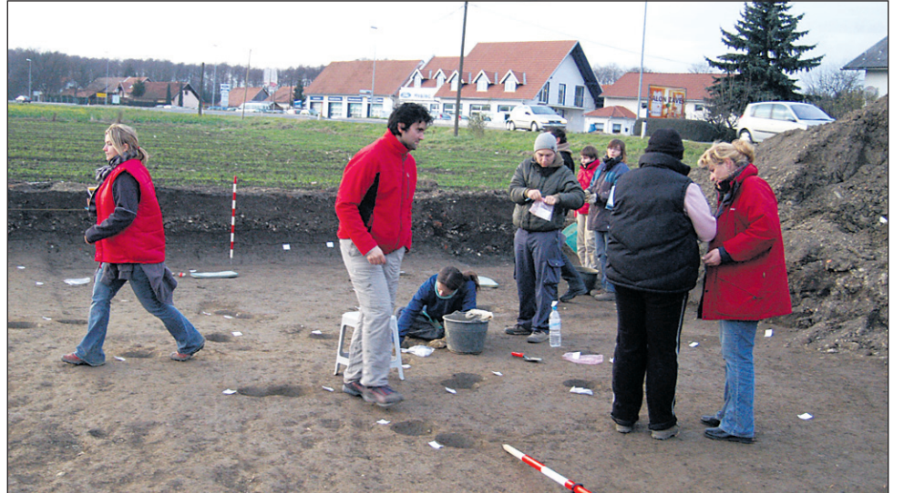
Prostor ob Mariborski cesti, na katerem so arheologi našli ostanke rimskih lesenih zgradb iz 2. in 3. stoletja

Trnovska vas • Zagotovili bodo prometno varnost