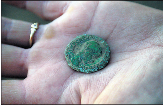
Najpomembnejša najdba je bronasti novic z likom cesarja Gordiana III., ki je vladal v 3. stoletju.