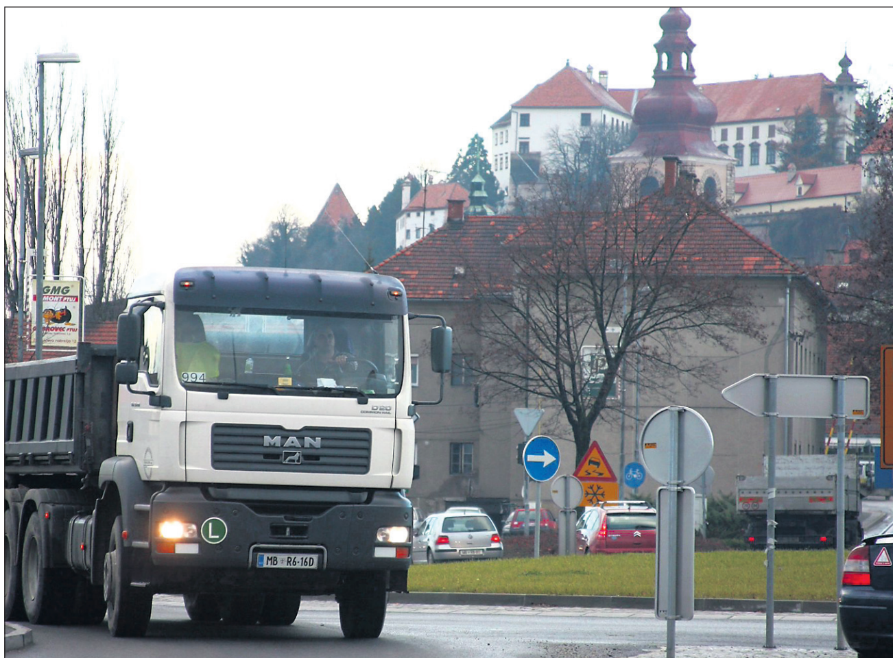
Skrozi ptujsko mestno jedro tovornjaki v bodoče naj ne bi več vozili.

»Z izgradnjo obvoznice je bilo omogočeno vodenje prometa mimo mestnega središča. Po sprostitvi prometa po novi cesti je bila prometna signalizacija za vodenje prometa v prvi fazi spremenjena tako, da je bil tranzitni promet v smeri proti Ormožu preusmerjen na obvoznico. Kljub postavljeni prometni signalizaciji velik del voznikov še vedno uporablja obstoječo cestno povezavo, skozi staro mestno jedro. Na Direkciji RS za ceste smo se zato v skladu z veljavnimi predpisi odločili za