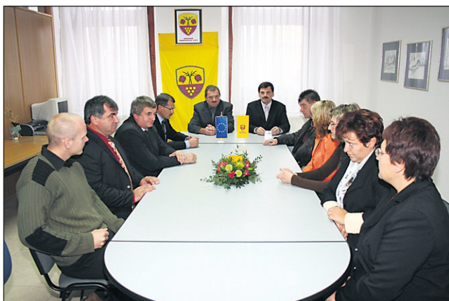
Sestanek je potekal za zaprtimi vrati.

Sabina Stanovnik, spec. zakonske in družinske terapije