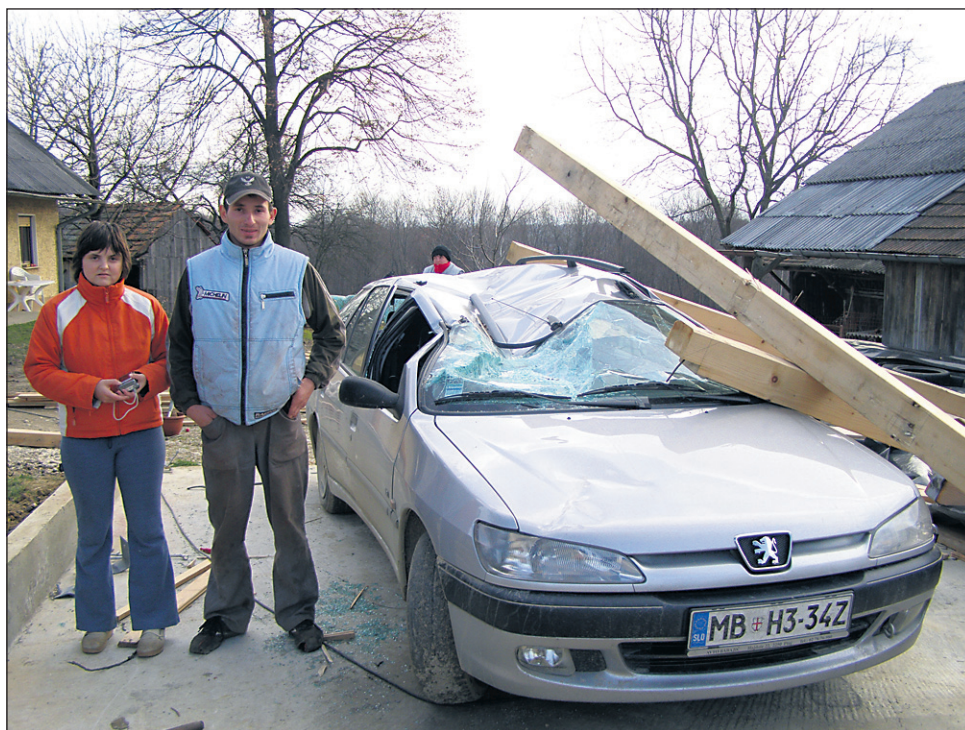
Mlada družina za novo gospodarsko poslopje in avto nima sredstev.