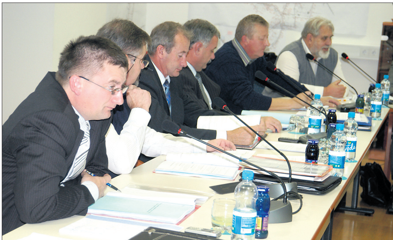
Tokrat so markovski svetniki prvič sejali z novo tehniko snemanja. Zraven mikrofonov za vsakega posamezno bodo svetnikom zagotovili še prenosne računalnike.

Ko so razpravljali o predlaganem soglasju k sklenitvi pogodbe o upravljanju športno-rekreacijske infrastrukture na Ptujkem jezeru oziroma na reki Dravi, so v razpravi menili, da občina take pogodbe ne more podpisati, saj ne more dati v upravljanje nečesa, če ni soustanovitelj ali solastnik objekta. Lahko pa ga na morebitno zahtevo da v brezplačno uporabo. Soglašali so tudi s predlaganimi spremembami odloka o nadomestilu za uporabo stavbnega zemljišča v občini Markovci; gre za spremembo oziroma povišanje vrednosti točke, ki se nanaša le na obrt-