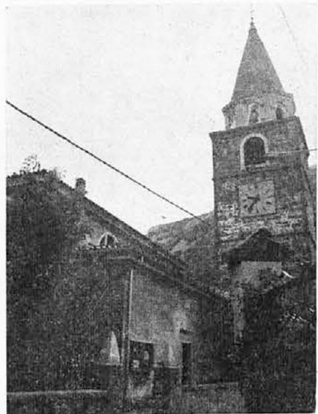
Pročelje farne cerkve v Boljuncu

V čitalnici »Primož Trubar« Narodne in študijske knjižnice v Trstu, ul. Sv. Frančiška, 20.