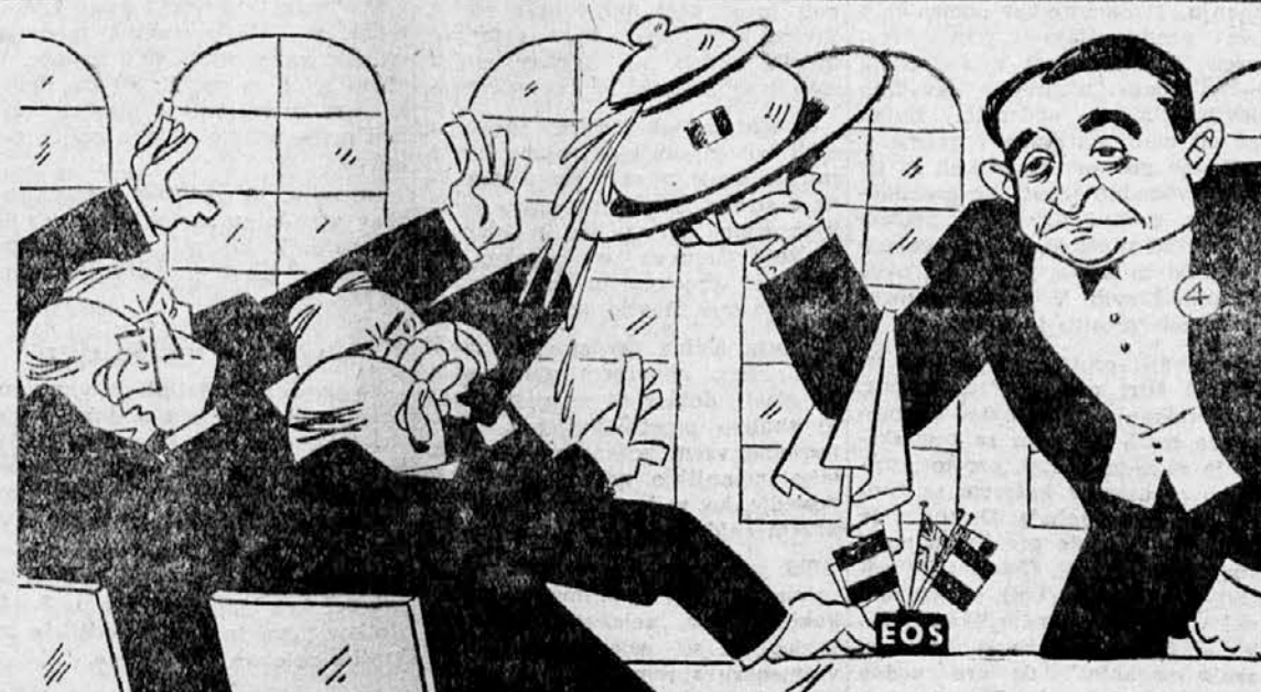
BRUSELSKI MENU A' LA MENDES FRANCE JE EVROPI POKVARIL OBLEKO IN ZELODEC

Dne 30. avgusta je nenadoma umrl lombardski primat, kardinal Defonso Schuster, knezoškof milanski. Z njim je katoliška Cerkev izgubila markantno osebnost. Med vojni je pok. kardinal rešil mnoga človeška življenja nacistični in fašistični maščevalnosti.