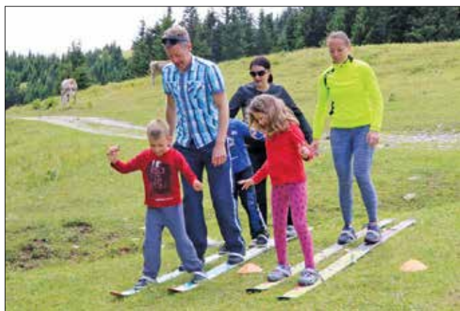
V smučanju po travi tekmovalnosti ni manjkalo.