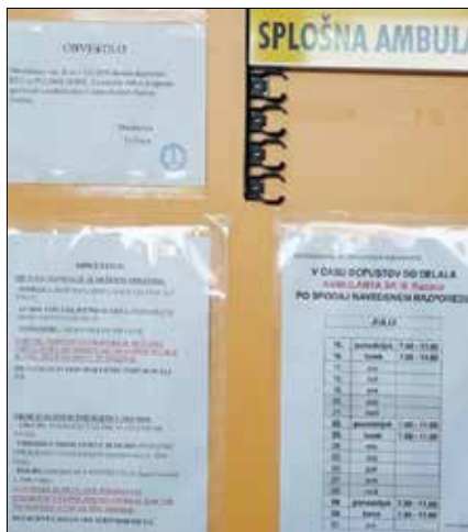
Na vratih ambulante so objavljeni urniki dela ambulant.

rica se je dogovorila, da lahko delata v Nazarjah pod vodstvom neposrednih mentoric. Obe se ve-