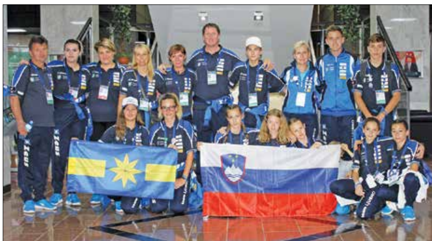
Šolarji in spremljevalci so v Ufi doživeli veliko lepega in nezabnega.

Ob prihodu v Ufo je bila ljubenska delegacija lepo sprejeta, nastanili so jih v President hotelu, kjer so se zelo dobro počutili. Uvodna in zaključna slovesnost sta bili odlično pripravljene, je povedal Kramer. Za udeležence je skrbelo več kot sto prostovoljcev. V Ufi so za igre zgradili novo infrastrukturo za atletiko, bazene in igrišča za odbojko. Kramer je še dodal, da smo v Rusiji Slovenci cenjeni in spoštovani, zato so bili povsod dobrodošli.