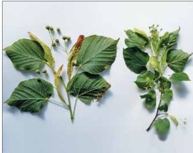
Listi lipe so opazno večji od lipovca, ki ga zato imenujemo tudi malolistna lipa.

sa drevesom žled, sneg in veter pogosto polomijo veje in vrhove.