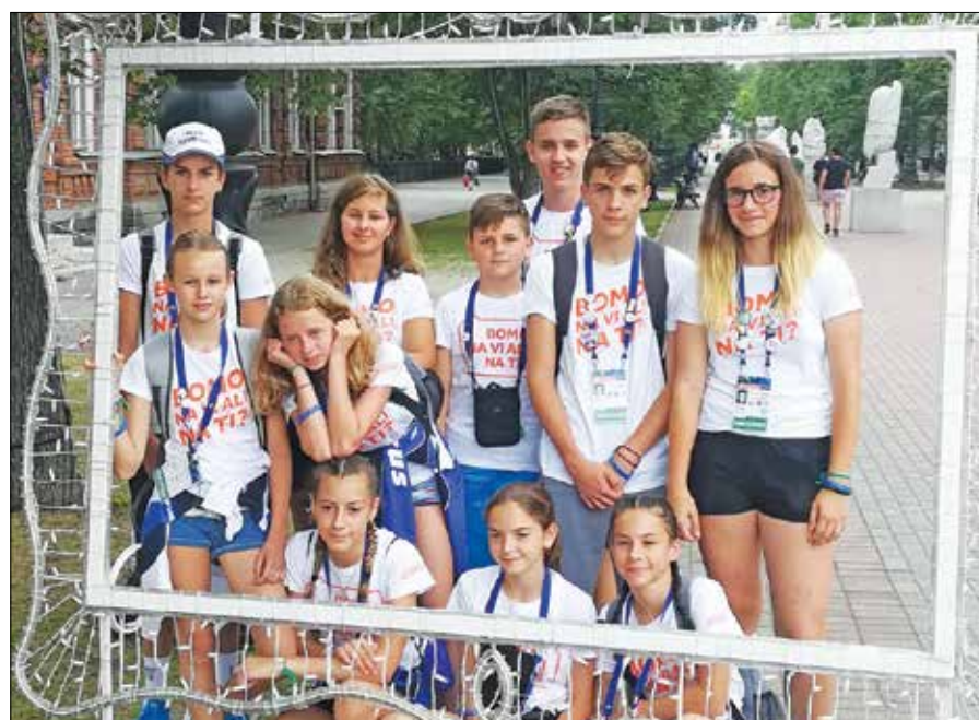
Enajst šolarjev se je na svetovnih otroških igrah v Rusiji pomerilo v atletiki, plavanju in odbojki na mivki.