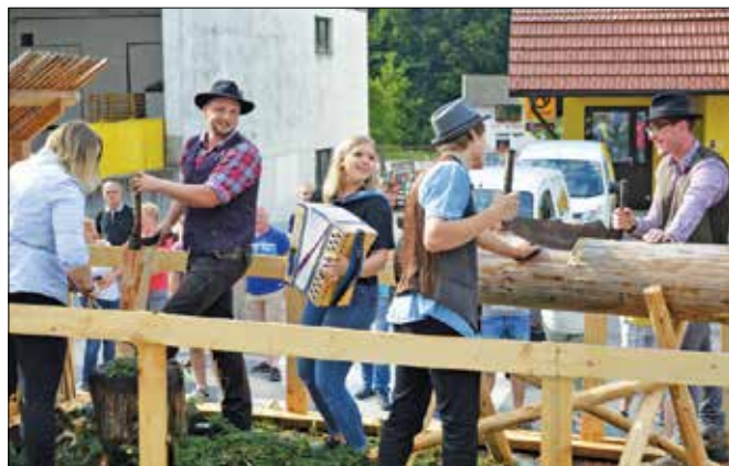
Zaselek Florjan je v povorki prikazal žaganje po starem.