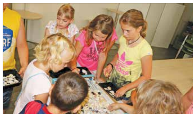
Otroci so na eni od delavnic ustvarjali slike s školjkami.