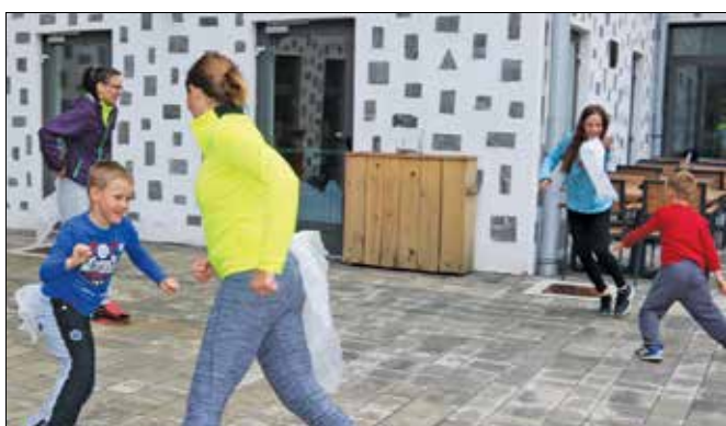
Na terasi hotela so za igro poskrbeli animatorji.

ličnih krajev Slovenije slišali, kako je zgrajena planota, kaj si je možno ogledati na Golteh in nenazadnje, kako je mogoče aktivno preživeti čas na tem območju v poletnih mesecih. V dobri uri hoje so prispeli do Koče na Treh plotih, kjer so jih čakali osvežilni napitki.