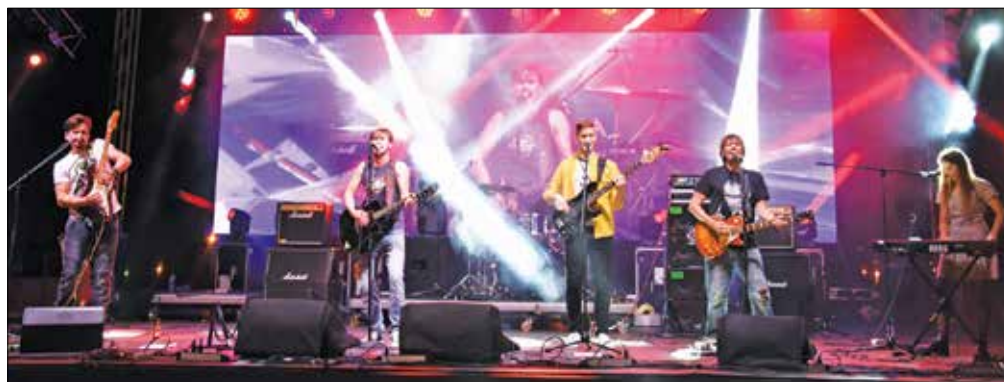
Mozirski rokerji so z izdelanim nastopom dvignili na noge obiskovalce festivala v Zaječarju.