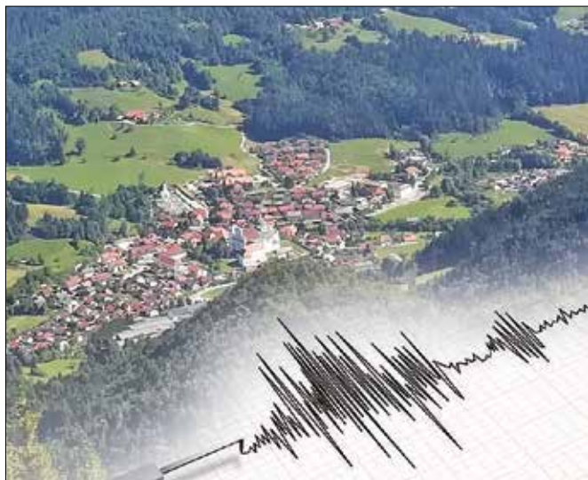
Žarišče potresa v soboto popoldan je bilo v bližini Gornjega Grada.