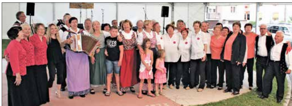
Na koncu so vsi nastopajoči družno odpeli naslovno pesem prireditve Oj, lepo je res na deželi.