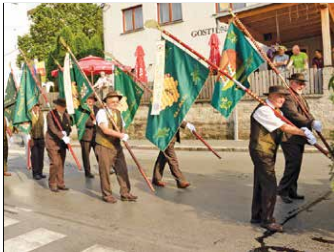
Čebelarjem že po tradiciji pripada vodenje povorke.

Obiskovalce, med katerimi je bil tudi nekdanji evropski poslanec Lojze Peterle , sta v povorki pozdravila medena kraljica Aleksan-