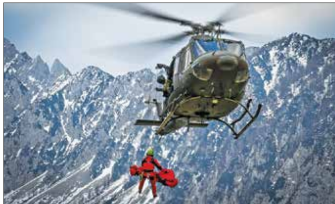
Reševanja v gorah s helikopterji potekajo samo v lepem vremenu.