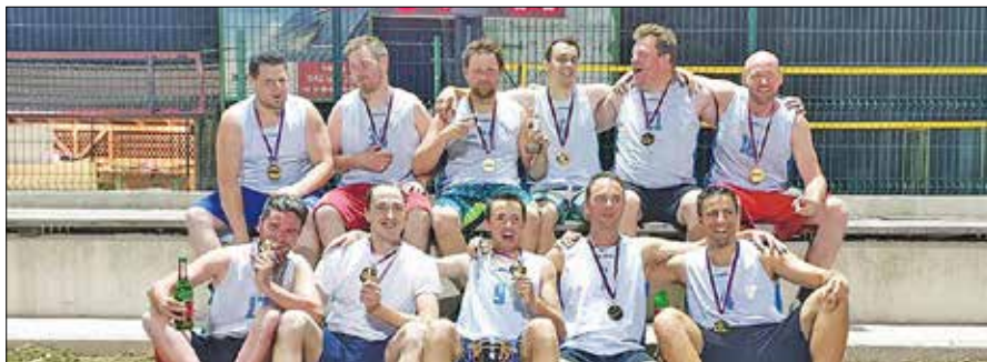
Ekipo ŠD Bočna je v zanimivi in borbeni tekmi pred več kot 100 gledalci premagala najmlajša ekipa v ligi Ta hitri.

Organizatorji že stremijo k naslednjemu dogodku v Lukni, in sicer košarkarskemu maratonu med Savinjsko in Zadrečko dolino, ki bo 7. septembra.