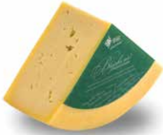
Blejski sir po ugodni ceni