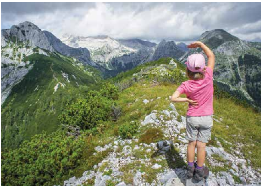
Foto: Aleš Ždešar, Srčni možje in srčni otroci: 240 let prvega pristopa na Triglav