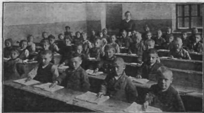
V ŠOLI PRI SV. JAKOBU V SLOV. GOR.

To je bila moja prva natisnjena pesemca. Z nepopisno radostjo sem jo večkrat prebral. Sladko čuvstvo zadovoljnosti in ponosa mi je napolnilo srce. Več dni sem potem skoro vedno mislil na to, kaj bi zopet spisal, da bi bilo vredno tiska. Začel sem zlagati dolgo novo pesem o žuborečem studenčku, zeleni livadi, pisanih cveticah in po-