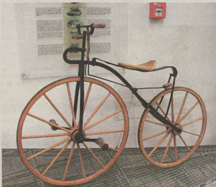
Znamenito leseno kolo iz leta 1895 iz zbirke Laurin & Klement, ki je tega leta začelo s proizvodnjo koles...

Ob obisku tovarne, kjer smo si ogledali zadnjo fazo proizvodnje oz. sestave avtomobila, smo ugotovljali, da potek proizvodnje spominja na veliko mravljišče, kjer vsak delavec točno ve kaj dela in soustvarja celoto. Red in organizacija sta na zelo visokem nivoju. Izvedeli smo, da za izdelava modela Fabia porabijo 40 ur dela (od tega jih kar osem »vzame« barvanje), pri tem pa sodeluje 500 robotiziranih rok. Organizacija na stotine robotov in 23.000 zaposlenih daje dobre rezultate, vsak pozna svojo nalogo, vsak pripomore k cilju - ena fabia vsako minuto. Za vpogled v osem urni plan so po celotni tovarni izobešeni digitalni zasloni, ki motivirajo zaposlene, imajo pa tudi dobre plače - 30 odstotkov nad povprečjem v državi. V tej tovarni izdelujejo avtomobile modelov Fabia in Octavia in tudi skoraj vse pogonske agregate.