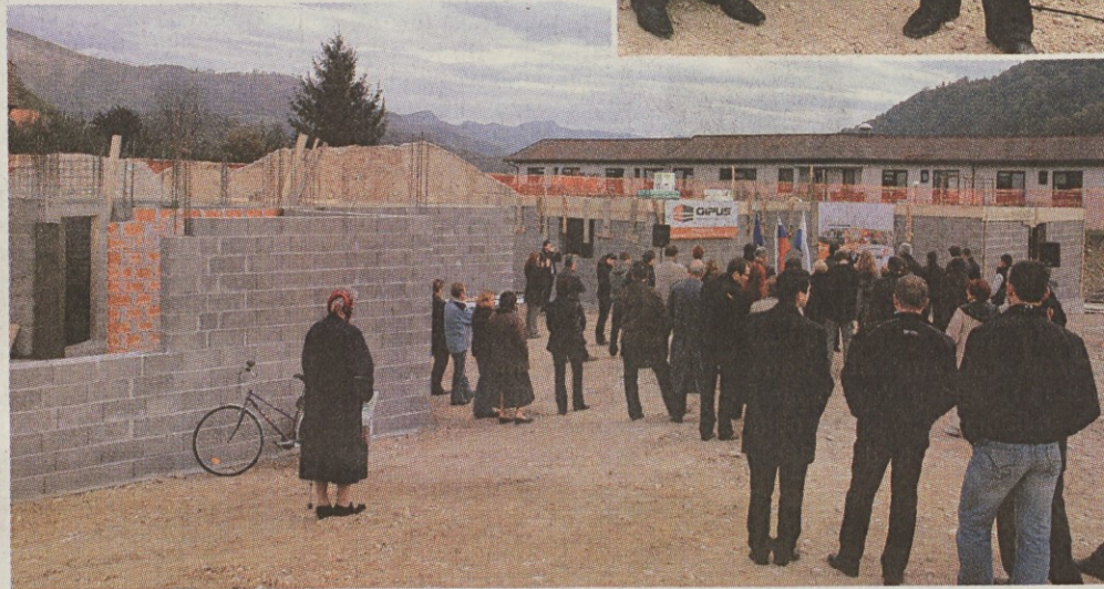
Prva oskrbovana stanovanja v občini, ki predstavljajo dolgoročno rešitev za starejše, že rastejo. Temelje je investitor z domačim izvajalcem - gradbenim podjetjem Gipus Radomlje, kateremu je v sodelovanju z lokalnimi podizvajalci zaupal izvedbo celotnega projekta, postavil že pred slovesno obeležitvijo.