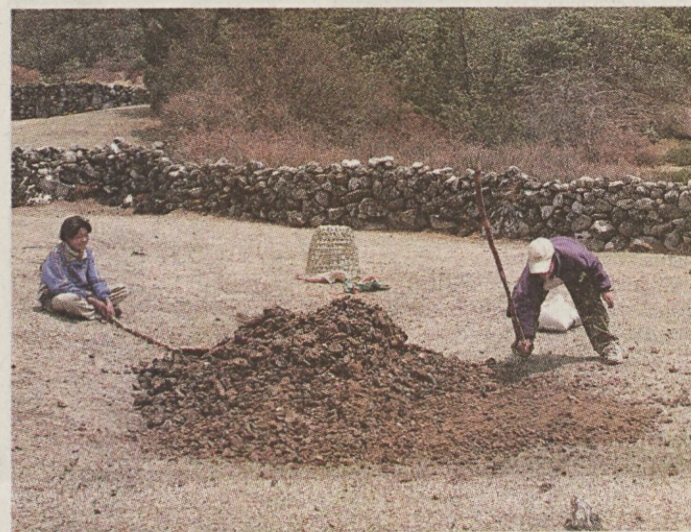
»Mlatilnica gnoja« - obratuje samo »en del«...