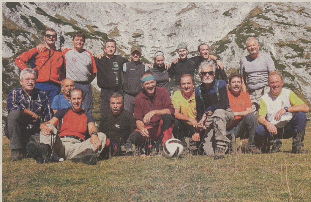
Obe moštvi po prijateljski tekmi.