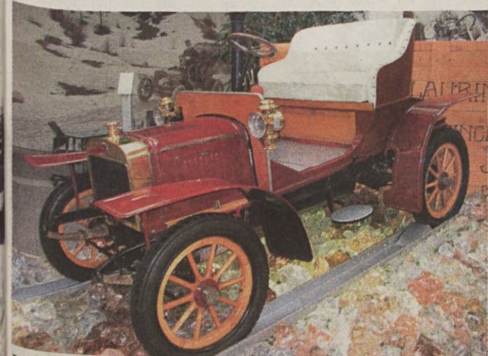
Leta 1906 sta Laurin in Klement na avtomobilski razstavi v Pragi predstavila tudi prvi avtomobil Voituretta A, ki je postal prodajna uspešnica in pojem klasičnega češkega avtomobila. Razstavljeni lepoteč z znamenito letnico 1906 je v ponos muzeju.

Proizvodnja se je širila in kmalu preseгла okvire družinskega podjetja, ki se je leta 1907 preoblikovalo v delniško družbo. V dvajsetih letih se je podjetje z namenom, da bi se uveljavilo in posodobilo svojo proizvodno linijo, ki je takrat obsegala številne tipe osebnih vozil in tovornjakov, avtobusov, letalskih motorjev in poljedelskih strojev, združilo z močnim proizvodnim partnerjem. Leta 1925 se je združilo s podjetjem Škoda iz Plzna, kar je botrovalo koncu znamke Laurin & Klement.