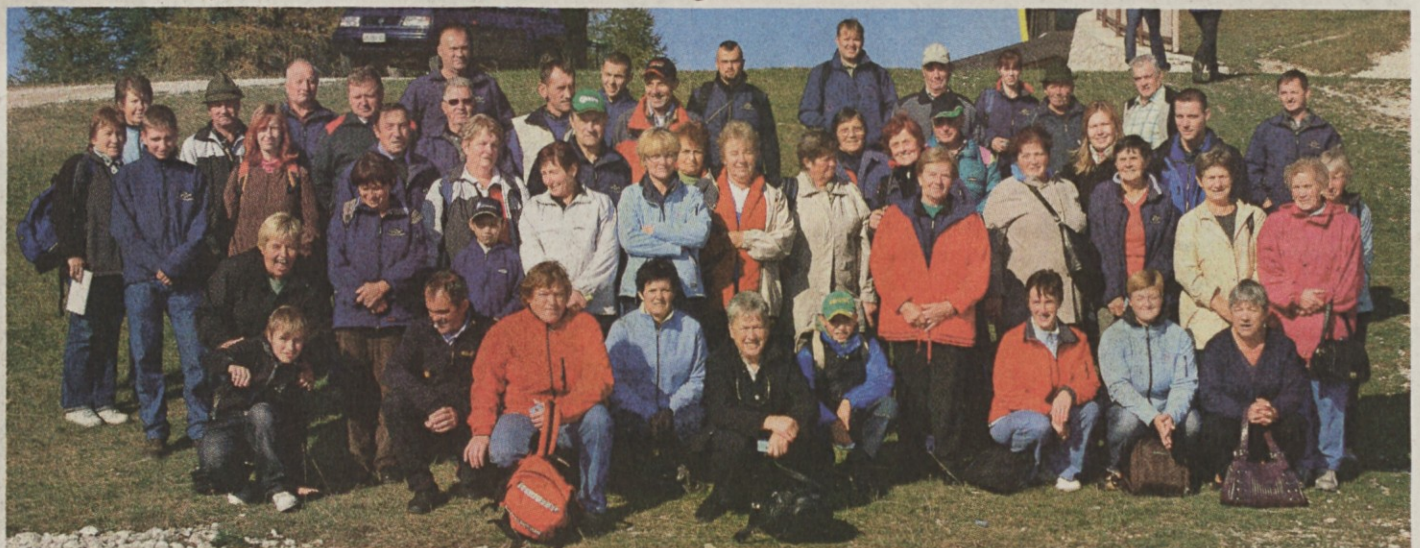
Velikoplaninski pastirji in gospodarji na Sv. Višarjah.

Pašna skupnost Velika planina ne skrbi samo za pašno planino na Veliki planini, ampak tudi za izobraževanje in družabno življenje. Tako že nekaj let zapored po koncu pašne sezone organizira izlet - ekskurzijo za pastirje, ki so poleti pasli živino na Veliki planini, kakor tudi za gospodarje. Tako so letos 3. oktobra obiskali najprej kar med potjo Svete Višarje, nato pa Rezijsko v Slovenski Benečiji - najzahodnejšo slovensko pokrajino, ki je že več kot 140 let pod Ita-