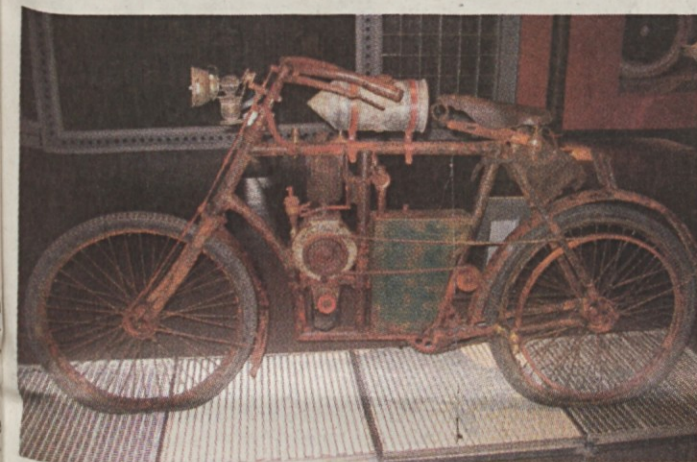
Leta 1899 je podjetje začelo s proizvodnjo motornih koles in iz prvih serij je razstavljen motocikel z letnico 1900.

V Škodinem muzeju smo spoznali modele tega znamenitega češkega proizvajalca od prvih začetkov ustanovitve podjetja Laurin in Klement. Na »potovanju« skozi čas smo spoznali razburljivo zgodovino tretjega najstarejšega proizvajalca avtomobilov na svetu.