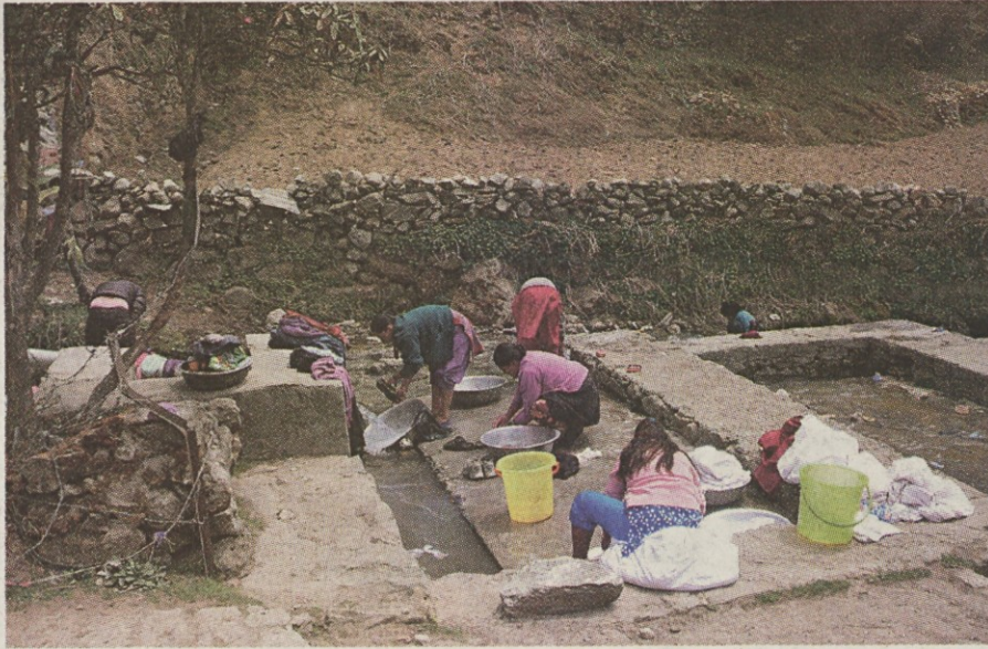
»Pralnica« v Namče Bazarju.

Iz Dingbočaja sva morala iti najprej kakšne pol ure navzgor do mostu, ker se nama ni dalo bresti mrzlo in de-ročo Imdžo. Nato je bilo potrebno iti tik ob reki, ker se nama ni dalo hoditi v gor in dol. Sprva so bile med nizkim grmovjem samo jakove stečine, tako da sva morala kar