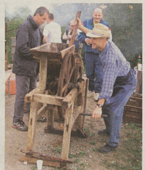
Stiskanje oz. drobljenje domačega sadja - jabolk za sladek mošt.

tekst: Štefka Legedič