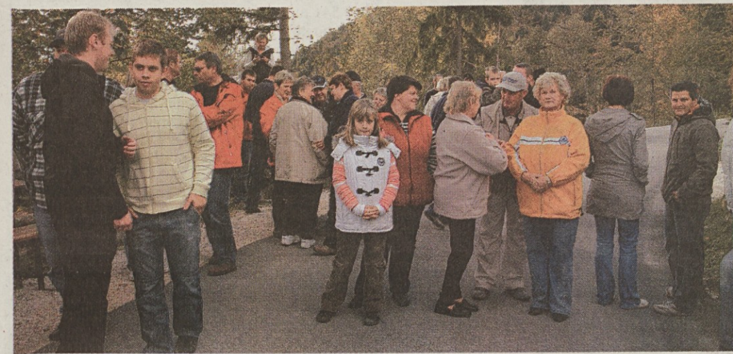
Slovesno odprtje nove pridobitve ob krajevnem prazniku je bila tudi priložnost za prijetno druženje in pomenke domačinov.