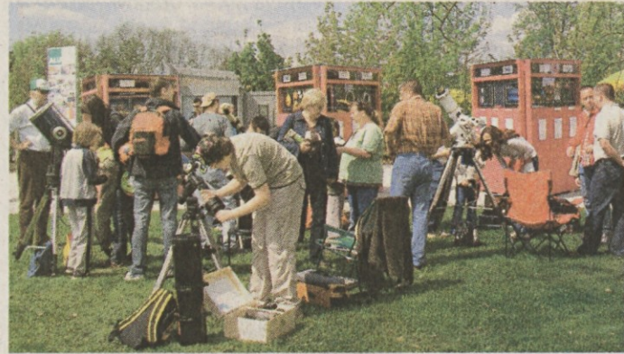
Z razstavo astronomskih slik in javnim opazovanjem Sonca so kamniški astronomi popestrili tudi dogajanje v Arboretumu Volčji Potok.

nomov je bila, da bi to veselje približali ljudem. Kamniški astronomi, zbrani v društvu Komet in RAKu (raziskovalno astronomski krožek na SCRM), smo vsako leto pripravljali že tradicionalno javno opazovanje Lune in katerega od planetov ter Spikino srečanje ljubiteljev astronomije, letos pa smo se še posebej potrudili. V okviru mednarodnega projekta 100 ur astronomije smo uspešno izvedli tako opazovanje Sonca kot Lune in Saturna, pripravili razstavo