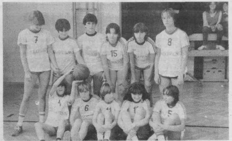
Ekipa košarkaric z osnovne šole Toneta Čufarja

Vrstni red: 1. ŠSD P. Voranc, 2. ŠSD T. Čufar, 3. ŠSD Ledina, 4. ŠSD M. Vrhovnik, 5. ŠSD J. Potrč, 6. ŠSD T. Tomšič, 7. ŠSD Prule