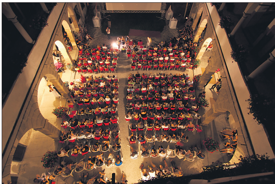
Kino brez stropa je letos privabil veliko gledalcev.