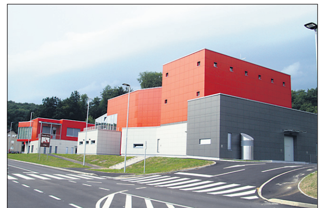
V centru Majšperka bodo v nedeljo odpri nov kulturno poslovni center, ki je veljal dobre 4 milijone evrov.