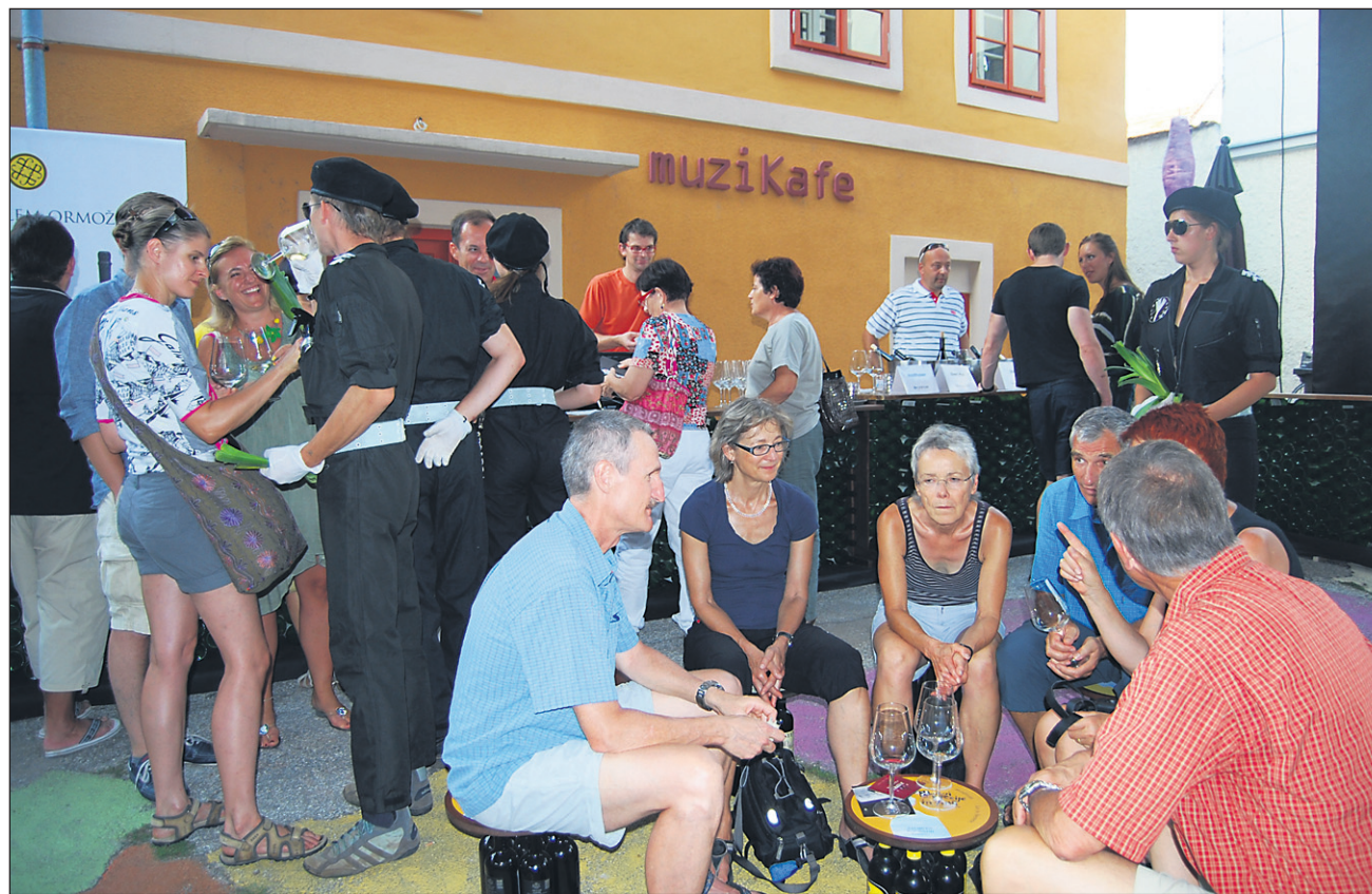
Dnevi poezije in vina od leta 2010 potekajo na Ptuj.

Ptujske asfaltirane ulice in mestni beton se bodo v prihodnjem tednu prelevili v travnike poezije. Pričenja se namreč 16. festival Dnevi poezije in vina, ki bo od ponedeljka v ospredje postavil verze in žlahtno kapljico. Na Ptuj se dogajanje prične v sredo z otvoritvenim branjem na Vrazovem trgu.