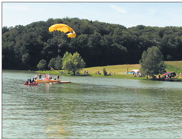
Ta konec tedna – od sobote dopoldne do nedelje popoldne – se bo na podlehniškem jezeru odvijal drugi padalski turnir za pokal občine v skokih na cilj na splav; lepo vreme je zagotovljeno, vstopnine za atraktivno prireditev z bogatim spremljevalnim programom pa ni.