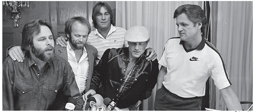
Zasedba The Beach Boys je ob obletnici pripravila več projektov: koncertno turnejo, izid spominskih zbirk uspešnic, dvojnega CD-ja ...

starejše generacije. Zasedba je zaslovela v 60. letih prejšnjega stoletja, njihov glasbeni slog pa zaznamuje harmonični vokali in spevna besedila. Skupino so pred petimi desetletji ustanovili trije bratje Brian, Carl in Dennis Wilson, njihov bratranec Mike Love ter prijatelj Al