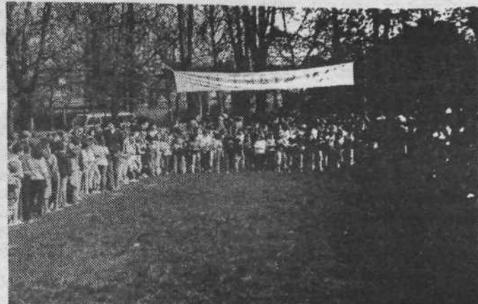
Občinskega prvenstva v krosu so se udeležili predvsem najmlajši. Na sliki start učencev drugega razreda osnovnih šol