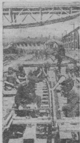
Montaža kretnic v tovarni mostov in kretnic v Nišu

V začetku avgusta je Narodna banka dobila od te tovarne pismo, v katerem zahteva nujen kredit v znesku 245 milijonov dinarjev za »kritje nadnormalnih zalog materiala«. Kredit bi vrnila v šestih mesecih. V