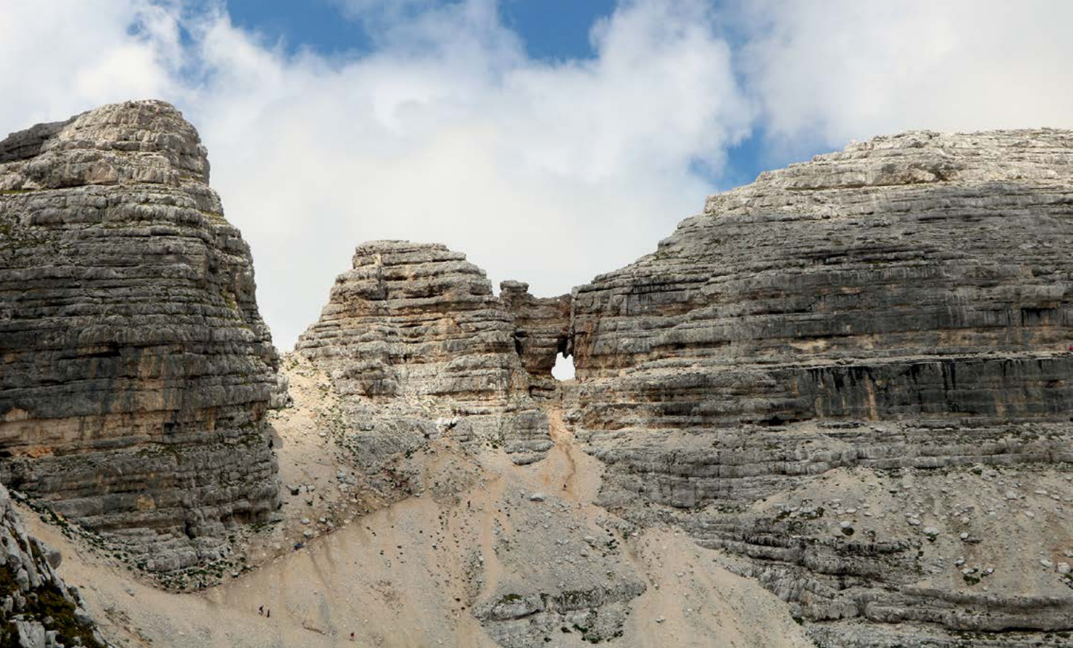
Pogled na Prestreljenikovo okno

težki oblaki, sem se odločila, da v svojem slogu raziskujem naprej. Maki so vnesli nežnost tudi na strmo melišče, ki izpod Prestreljeniškega okna pada proti Velikemu Grabnu. Skalna pregrada nad Grabnom, ki mu pravimo tudi Tiha Dolina, zastira pogled proti Kaninskim podom. Ko prelezemo nekaj skal, kjer so celo varovala, se pred nami odpre razgled, ki jemlje dih. Na sedlu pod Hudim Vrščem je razpotje. Pot se nad Dolgimi prodi zložno dviga proti Kaninu, druga pa obrne na jug, proti vrhu Osojnic in Domu Petra Skalarja.