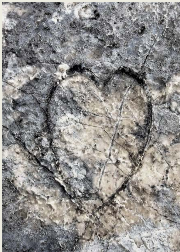
Megalodontidna školjka v obliki srca

včasih veljale za okamnena srca čarovnic. Imela naj bi čudežno moč, zato so jih uporabljali tudi v zdravilstvu. V nedojemljivi razsežnosti tega prostora in časa – glede na dolgost našega bivanja, jih je, zakopane v usedlino in v procesu fosilizacije, skupaj z drugimi morskimi bitji, izvrгло morje. Poznamo jih več vrst, pri nas pa so najpogostejše megalodontidne školjke . Ponovila se je ista zgodba kot pri iskanju najlepšega maka, in trajala, vse dokler mi v skalah ni zmanjkalo src. Še sreča, da me nihče ni čakal in mi tako že s samim zašiljenim pogledom – kar sicer razumem, povzročal stiske.