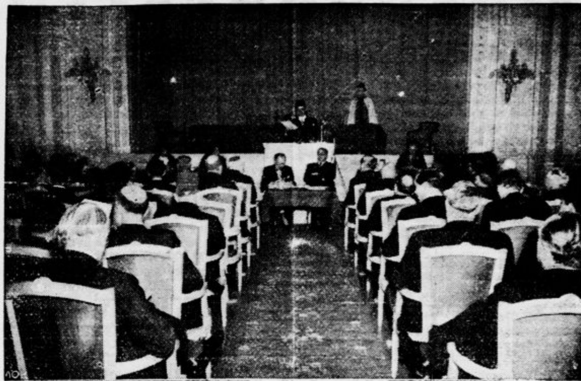
Mustafa Nahas paša, šef egiptске vlade, med otvoritvenim nagovorom