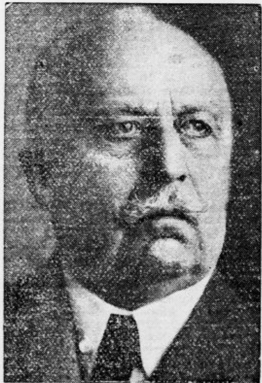
Najnovejši posnetek generala Ludendorffa, ki se je šele pred kratkim sprijaznil s kancelarjem Hitlerjem. Ludendorff nastopa zdaj kot fanatičen propovednik novega poganstva