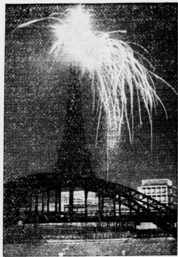
Z vsemi sredstvi se Pariz trudi, da bi letos privabil čim več tujcev na svetovno razstavo. Na vrhu Eiffelovega stolpa spuščajo od časa do časa tudi umetnalne ognje, ki kažejo najboljšo, kar je doslej v tej stroki ustvarila pirotehnika