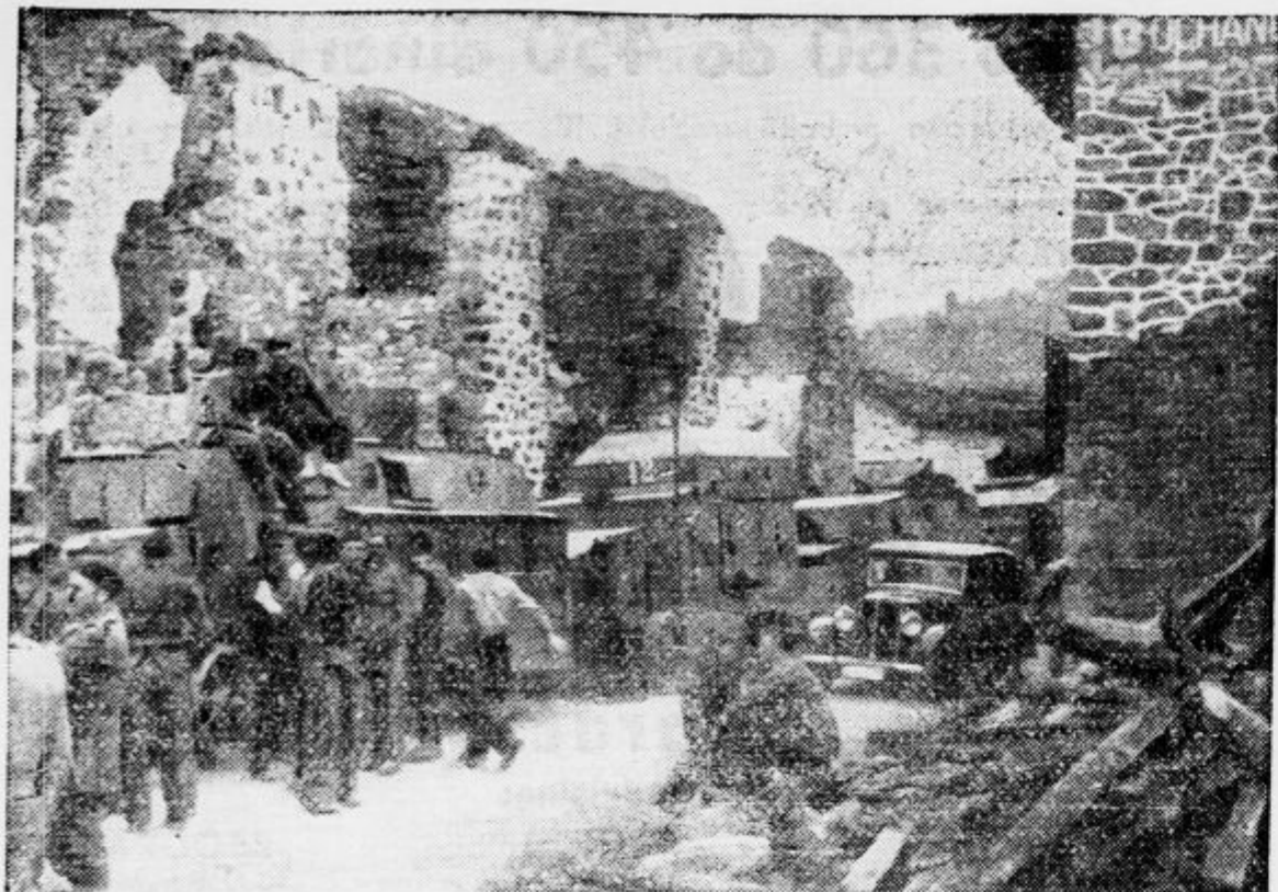
so čete generala Franca vkorakale v Orreagiano na baskijskem bojišču