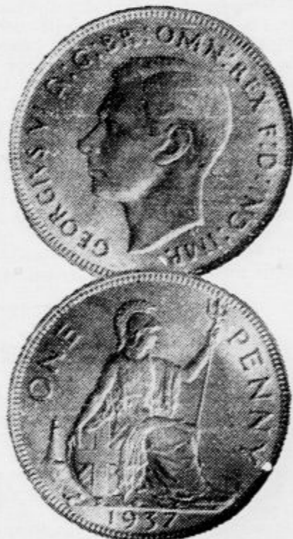
V Angliji so izročili prometu nove novce po en penny, prve novce s sliko kralja Jurija VI. Kovance kaže zgoraj čelno, spodaj pa hrbtno stran