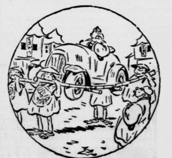
»Noben moj avto ni porabil tako malo benzina kakor ta...« (Everybody's weekly)