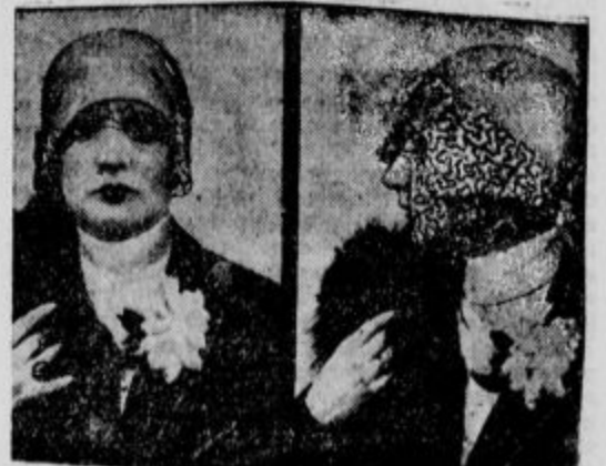
Kaj nosijo najmoderneje Parižanke na glavi.