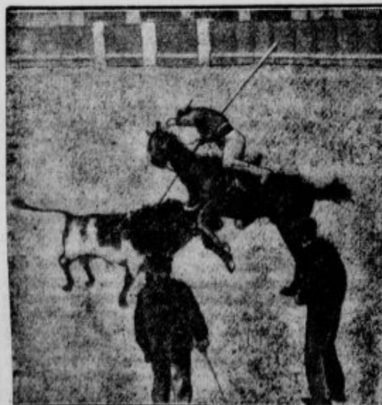
Za življenje gre! V španski bikoborbi se zgodi, da razjarjen bik konja enostavno nabode na roge.

na obeh straneh kanala so se izkazale kot razjedene in trhle ter je bilo treba kanal varovati z umetnimi zidovi. Razen tega je pa ravno pod to ožino ognjišče potresnega gibanja, kar se je pokazalo topot. Poročila sicer pravijo, da je ostal kanal, ki so ga otvorili leta 1893. in je 22 metrov širok, nepoškodovan, vendar se je zelo bati, da ga nekega dne doleti usoda, kakor je doletela staro in novo mesto Korint.