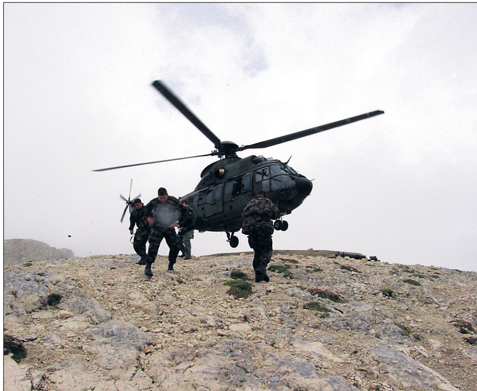
Po nekajurnem čakanju je helikopterju SV uspelo pristati na Kredarici.

Iskrene čestitke vsem dobitnikom nagrad!