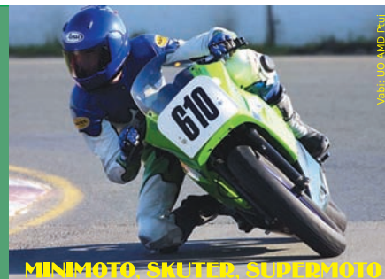
MINIMOTO, SKUTER, SUPERMOTO

MEDNARODNA MOTOCIKLISTIČNA DIRKA KARTODROM HAJDOŠE, NEDELJA 3. 9. 2006, OB 14. URI