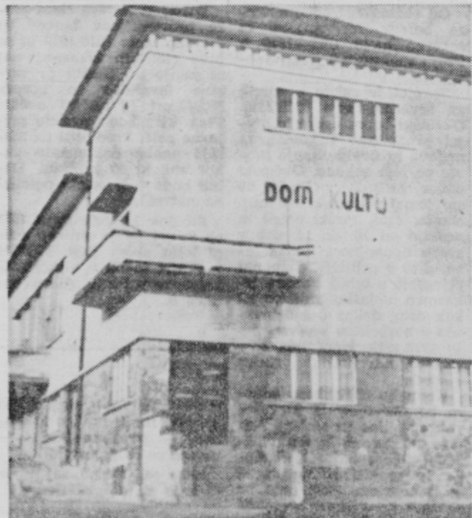
Dom kulture v Slovenski Bistrici, domena nekaterih...

Ne dajte se izzvati! Če drugi že res hoče igrati ognjem, pustite ga, naj igra sam. Kdor nasede v vaču in se odloči za prvo dirko, povečuje nevarnost na cestah in velikokrat b ča v prav tistem jarku izzivač. Kdor se da izzvati ni nič bolj pameten kot izzivač. Pameten šofer se zmeni zanj.