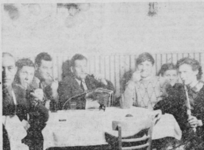
Posnetek s tekmovanja velikonedeljskih fajfarjev: »Nobena fajfa tak ne fajfa, kak fajfajo njihove fajfe!«