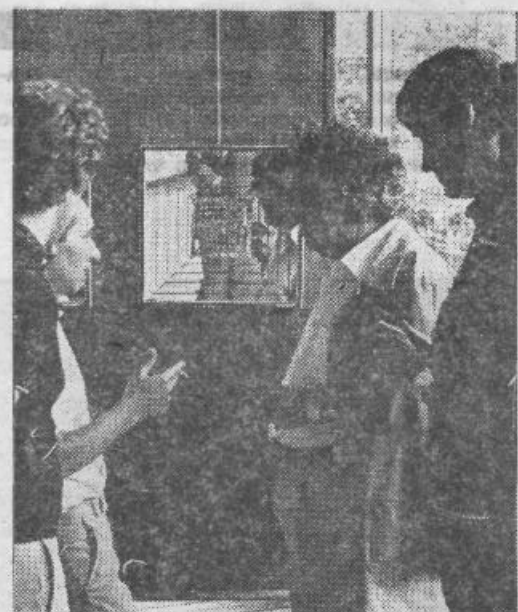
Umetnikovi besedi (drugi z leve) so obiskovalci razstave z zanimanjem prisluhnili