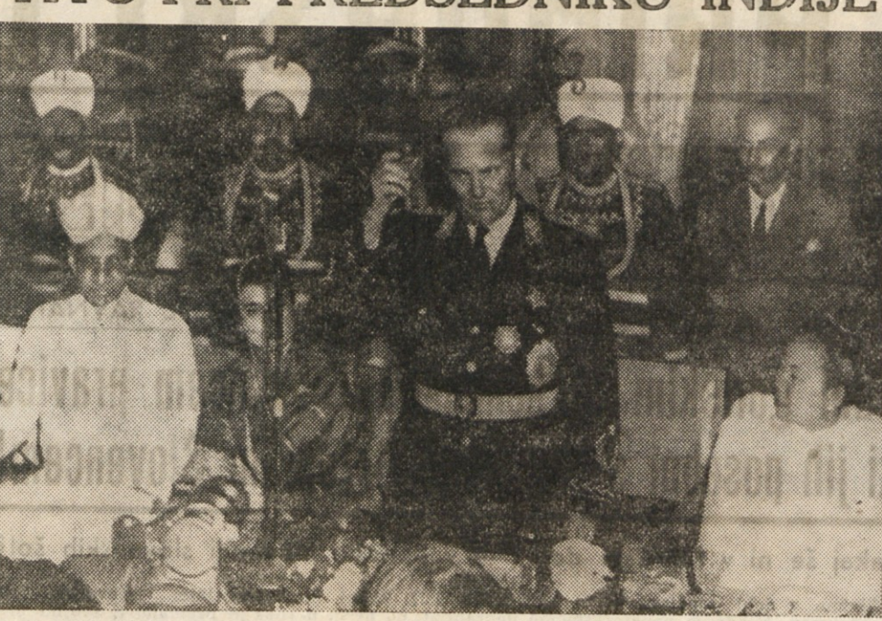
Predsednik republike Tito napiva predsedniku Indije dr. Prasadu na svečanem banketu, ki ga je predsednik Indije priredil njemu v fast v palači Rastrapati Bavan. Na levo od Tita sta gospa Indira Gandhi in podpredsednik Indije dr. Radakrisnan

S POTOVANJA ČEZ SEVERNI TEČAJNIK MED LAPONCE