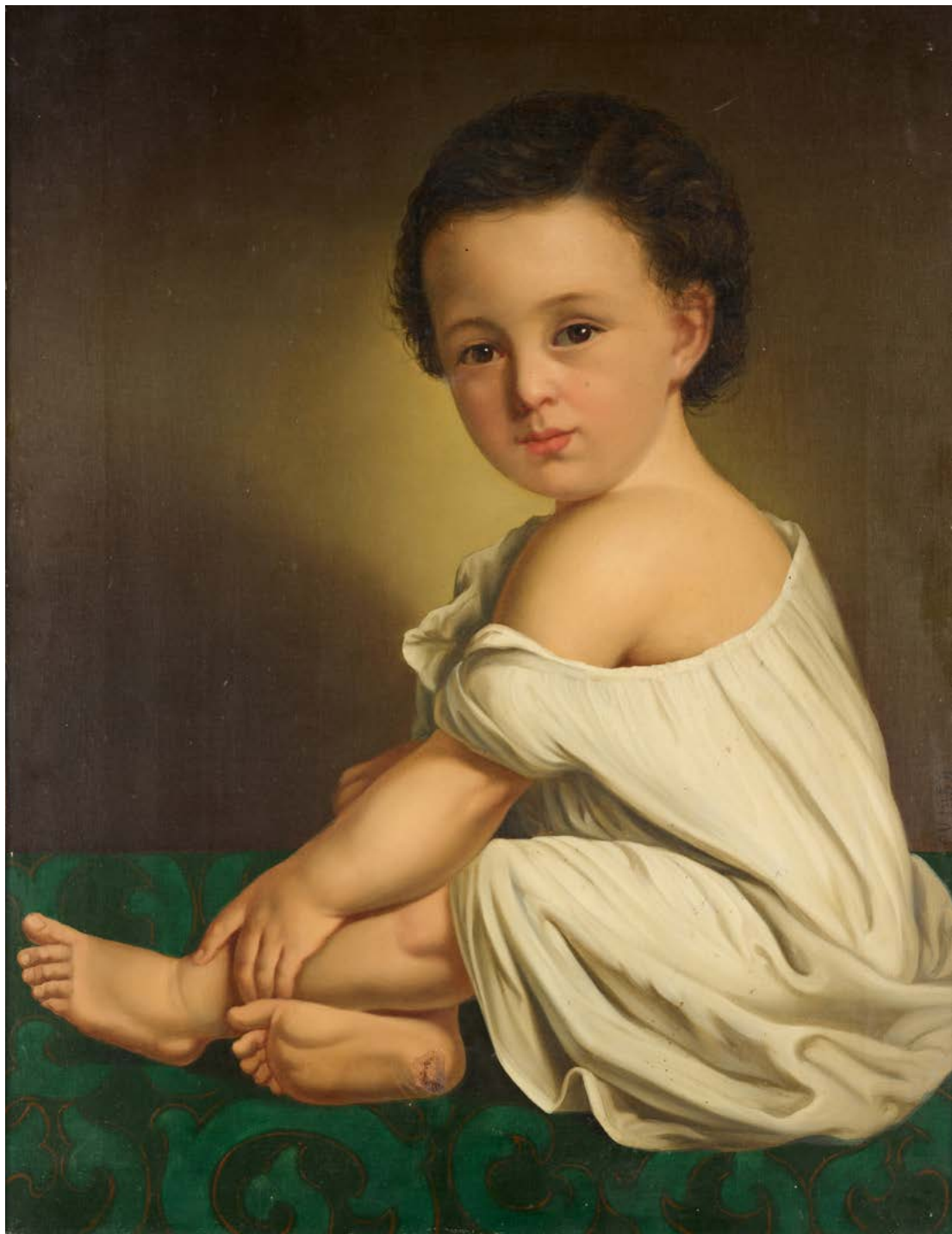
15. Carl Vogl: Otrok v srajčki , 1858, Maribor, Pokrajinski muzej Maribor