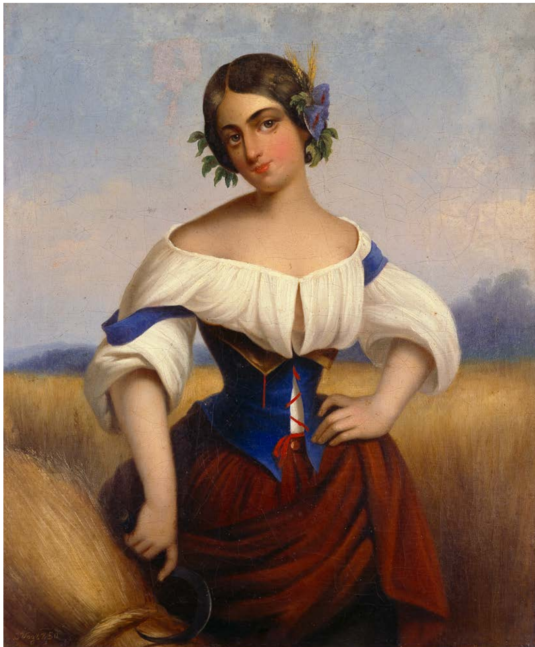
6. Carl Vogl: Žanjica, 1850, Novo mesto, Dolenjski muzej