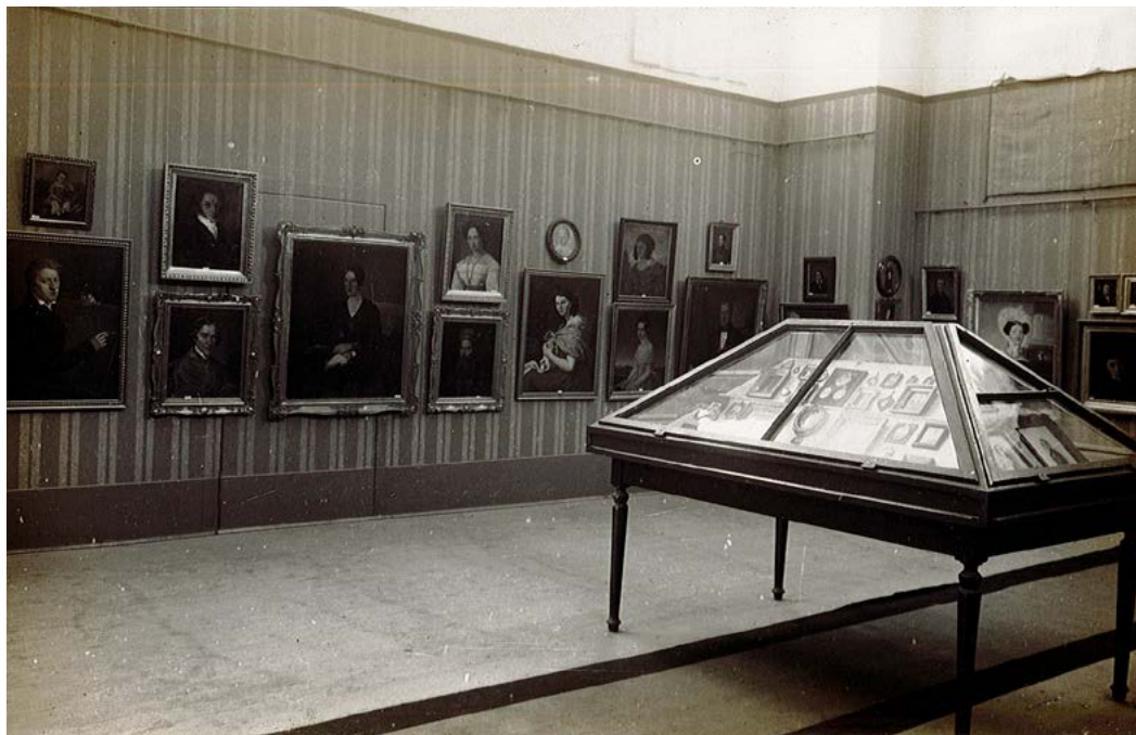
8. Pogled na Razstavo portretnega slikarstva na Slovenskem z Voglovim portretom sedeče deklice na skrajni levi zgoraj, 1925, Ljubljana, Narodna in univerzitetna knjižnica