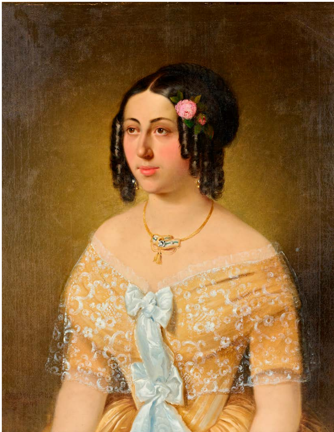
14. Carl Vogl: Soproga mariborskega trgovca, 1849, Maribor, Pokrajinski muzej Maribor