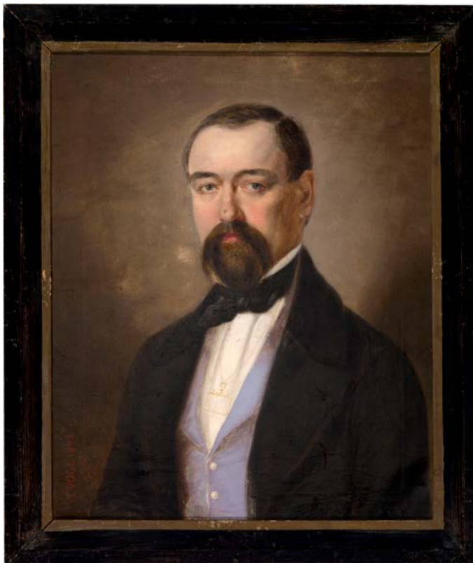
5. Carl Vogl: Portret Simona Luka Pesjaka, 1848, Ljubljana, Narodni muzej Slovenije