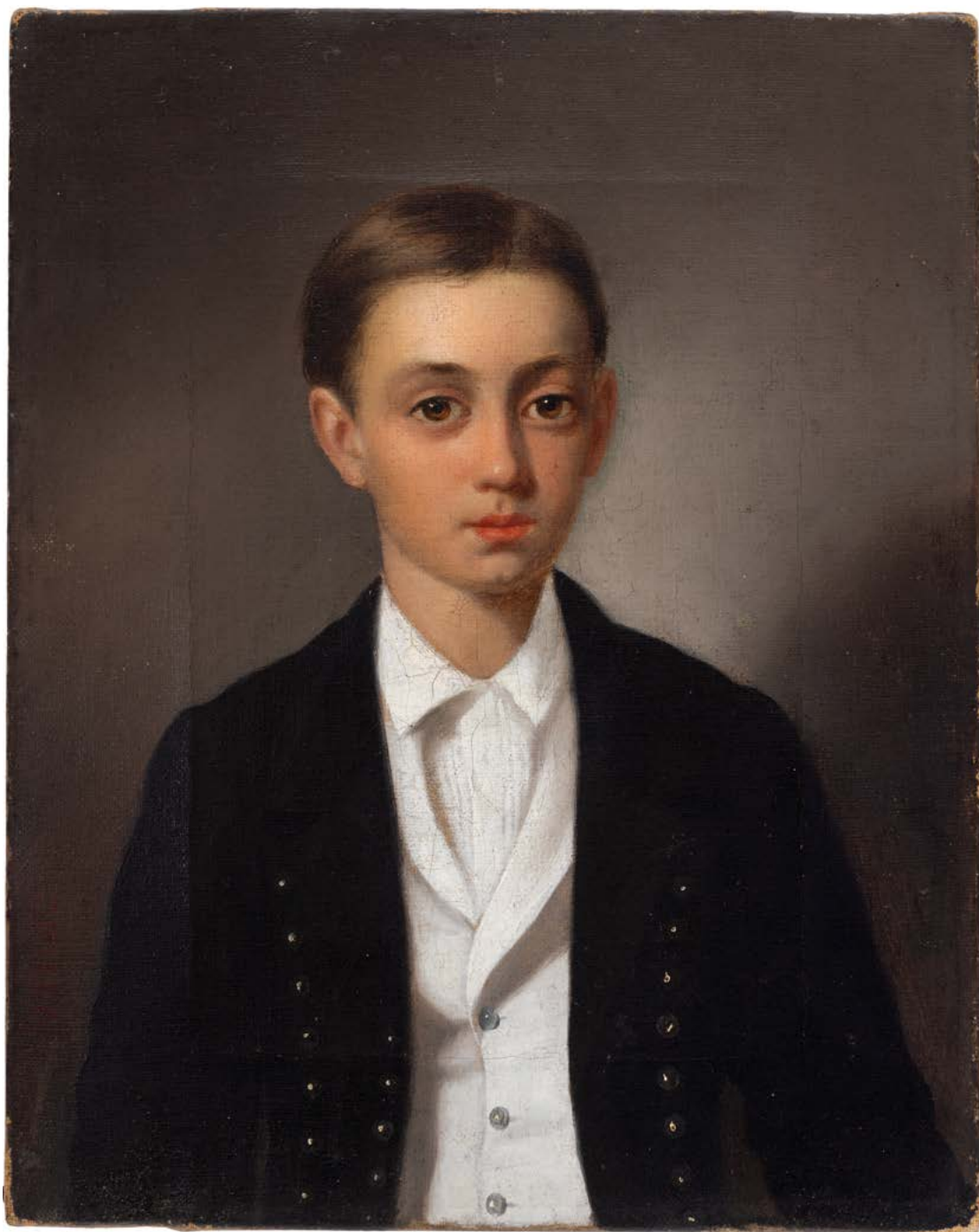
19. Carl Vogl: Portret Ljudevita Tomasija ml. , 1860, Varaždin, Mestni muzej Varaždin