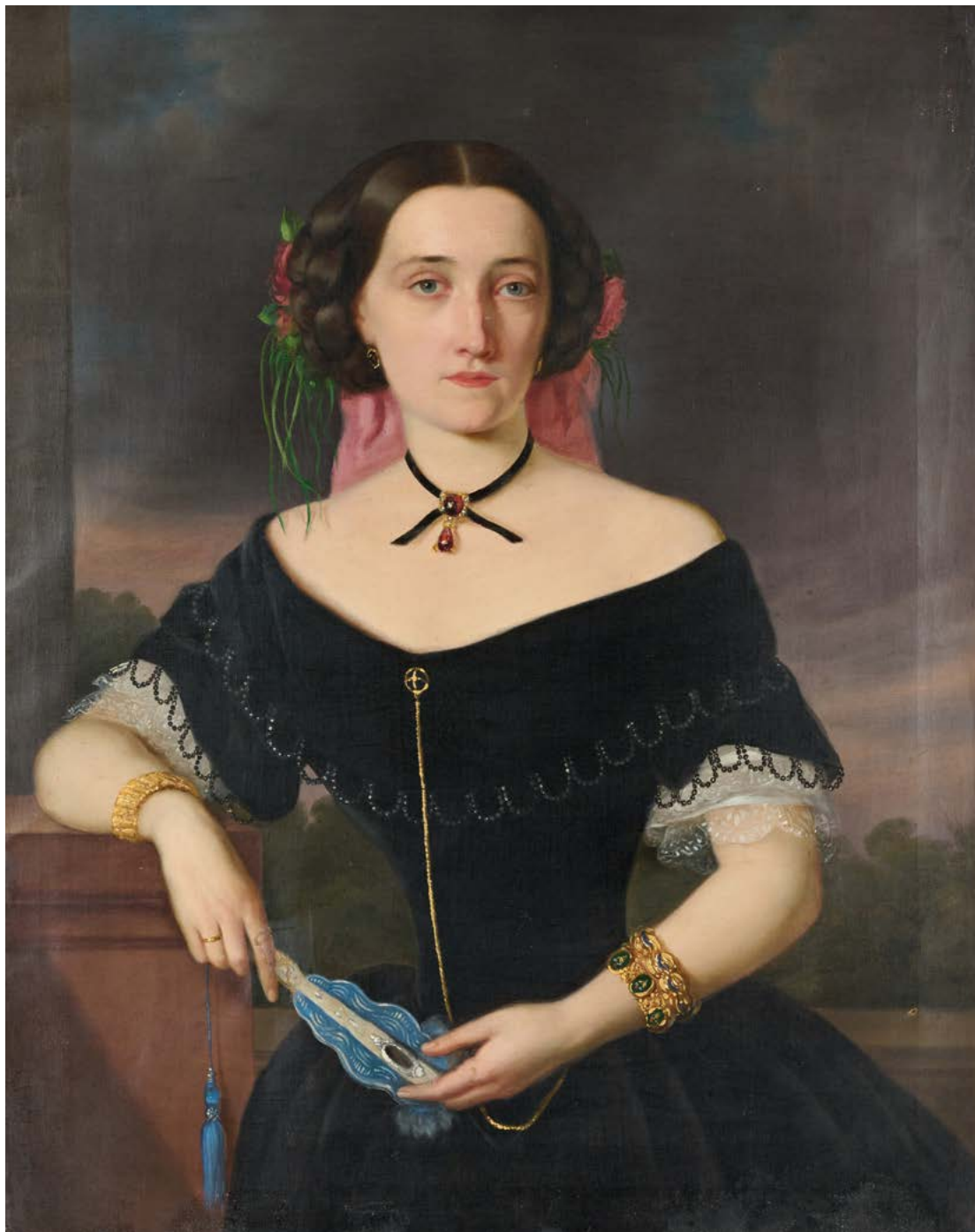
12. Carl Vogl: Žena s pahljačo, 1858, Maribor, Pokrajinski muzej Maribor