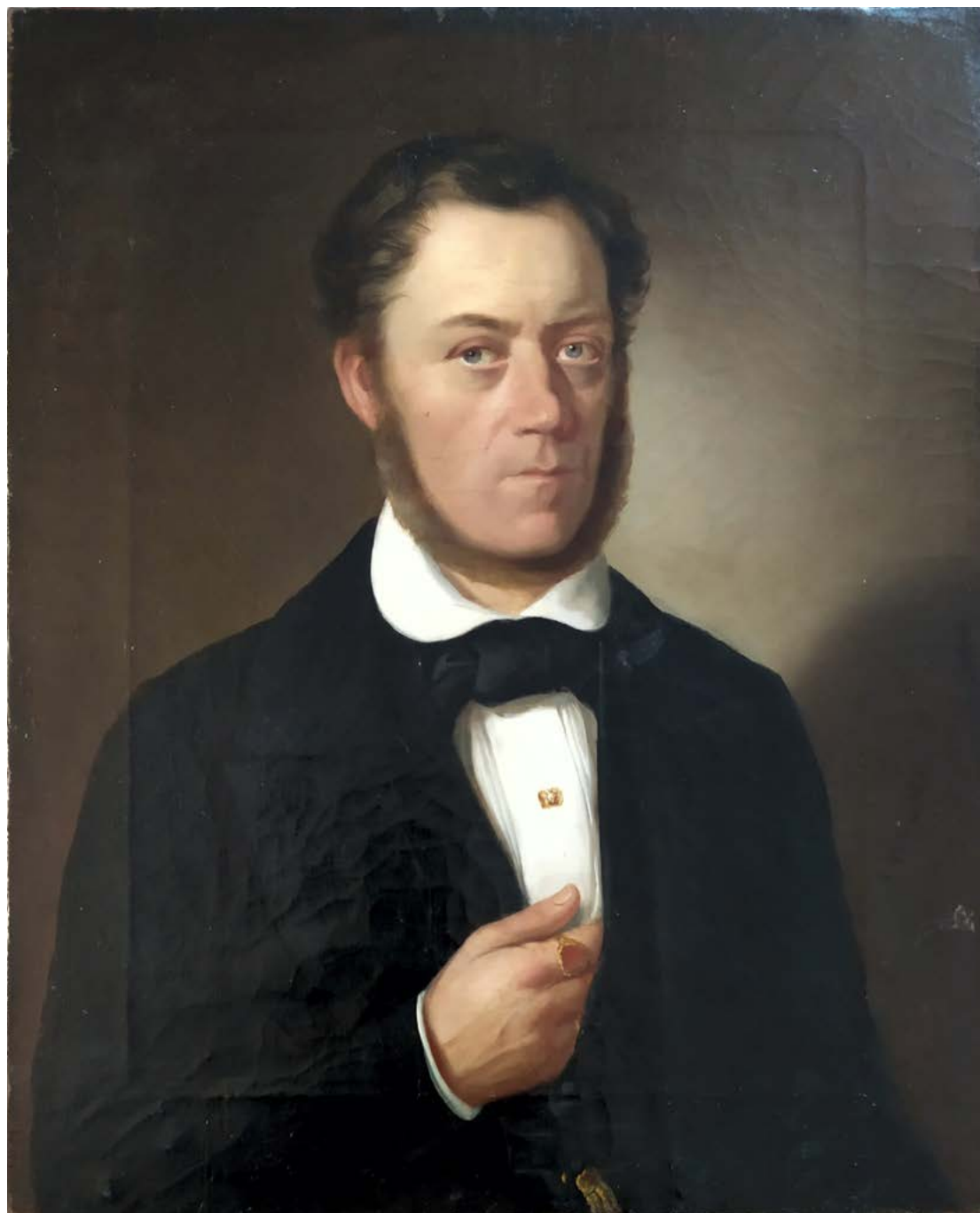
17. Carl Vogl: Portret Ignaca Antona Hackla, 1851, Litoměřice, Severnočeška galerija likovnih umetnosti