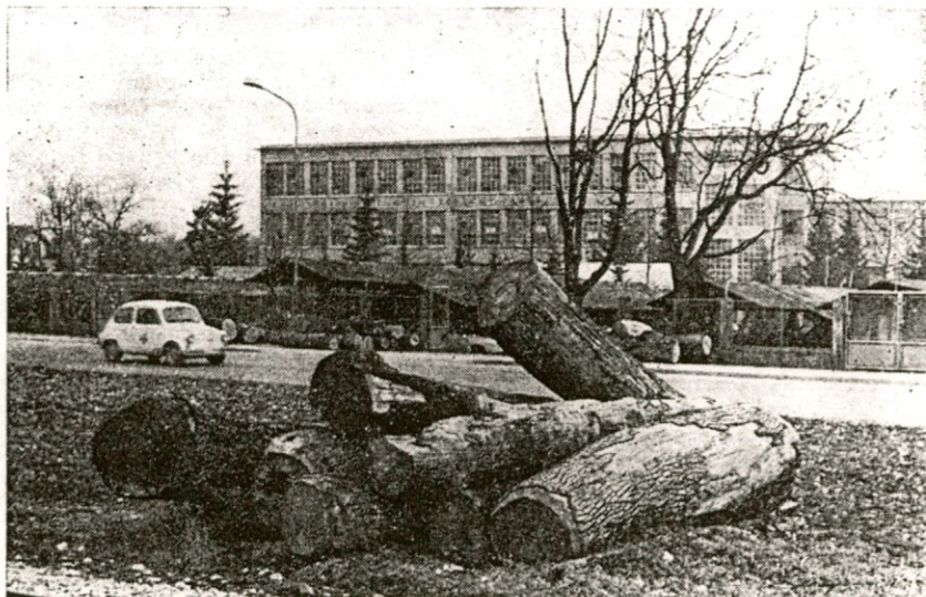
Podiranje topolov (članek na 11. strani)