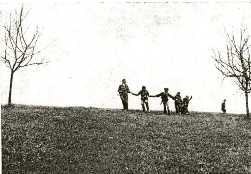
PRIHOD POMLADI

Predvsem letos pa je praznovanje prvega maja povezano z uveljavljanjem sklepov, ki nas zavezujejo, da se bomo v doglednem času gospodarsko utrdili. Parole, vedno smo jih pisali za 1. maj, bi naj glasila: BOLJŠE IN VEČ DELATI. V DELO VLOŽITI NAJVEČJO MOŽNO MERO ZNANJA. SPOŠTOVATI VSE SPREJETE ZAKLJUČKE, KI NAS NAJPREKALJENE PRIPELJEJO V LEPŠI JUTRIŠNJI DAN.