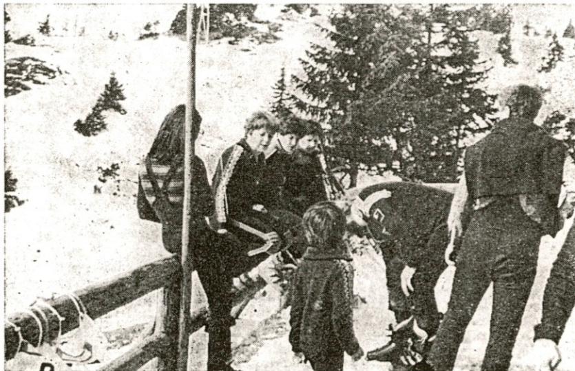
Naši smučarji pred startom za »Zlato nit«