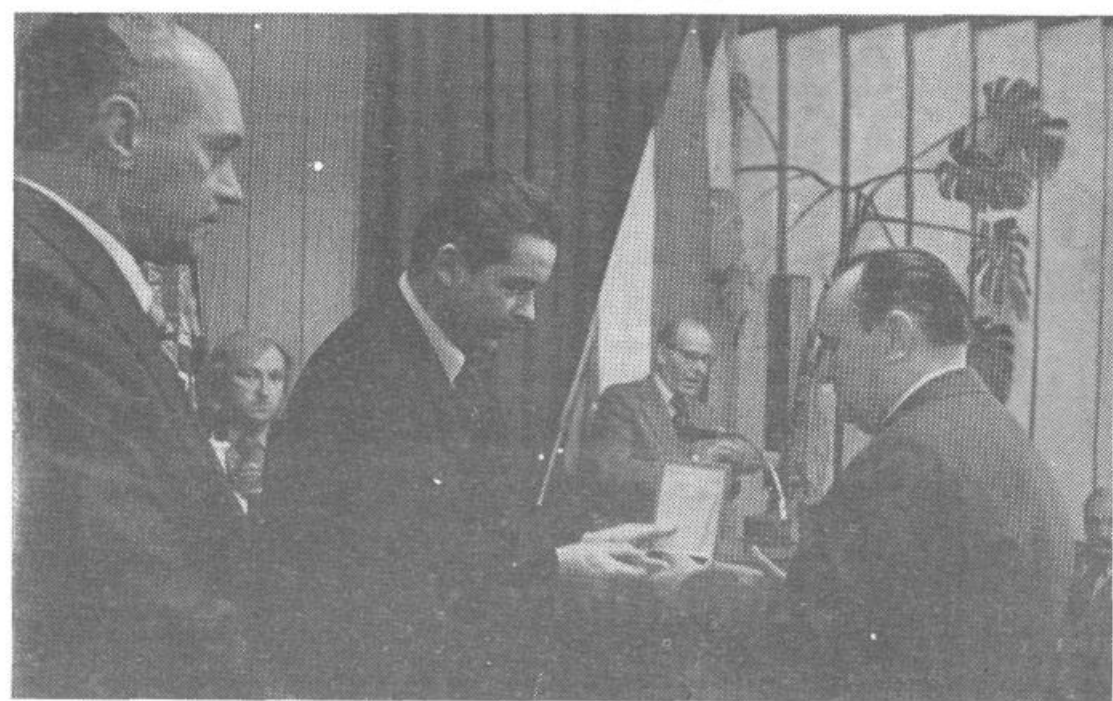
Podeljena so bila tudi odlikovanja predsednika republike

Informacija o izvajanju zakona o združenem delu pa je predstavljala le osnovo za temeljitejša poročila, ki ga bo za to imenovana skupščinska komisija predložila v razpravo delegatov predvidoma v mesecu marcu. Vsekakor pa bomo lahko prav na podlagi te informacije pričakovali ob razpravi večji odziv s strani delegatov zbora združenega dela.