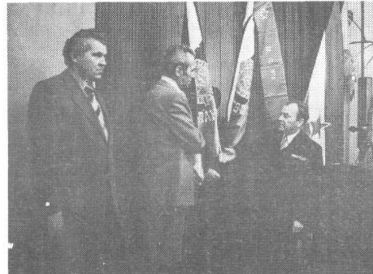
Ob razvitju prapora KO ZRVS Krim-Rudnik