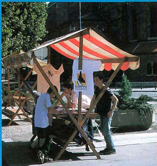
Stojnica v Mariboru.

za izvedbo projekta. Prav tako se zahvaljujemo podjetju Nigrad iz Maribora, ki nam je letos že drugo leto odstopilo stojnico v Mariboru, in glavnemu pokrovitelju projekta v Sloveniji, družbi Mobitel.