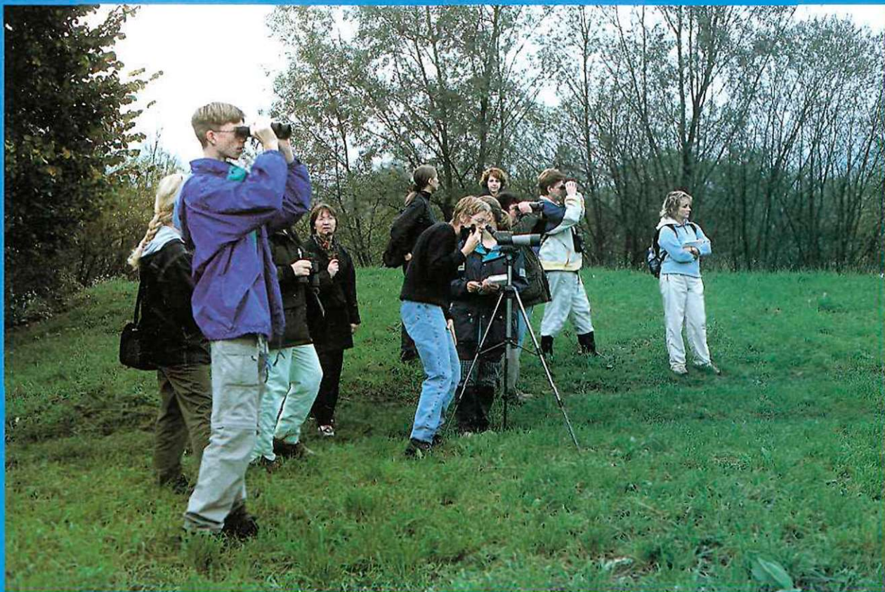
Izlet na Ljubljansko barje v nedeljo 7. oktobra 2001