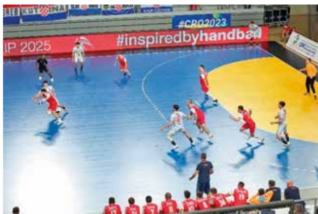
Serija slik 6. Drugi desni branilec prestreže podajo med desnim in srednjim zunanjim napadalcem (polfinale: Hrvatska – Španija)