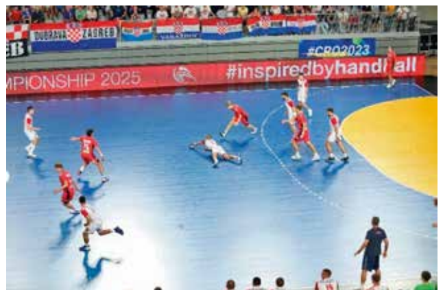
Serijska slika 5. Branilci si priborijo žogo, ki jo je napadalec slabo sprejel (ulovil) – podaja med levim in srednjim zunanjim napadalcem (četrtfinale: Hrvaška – Norveška)