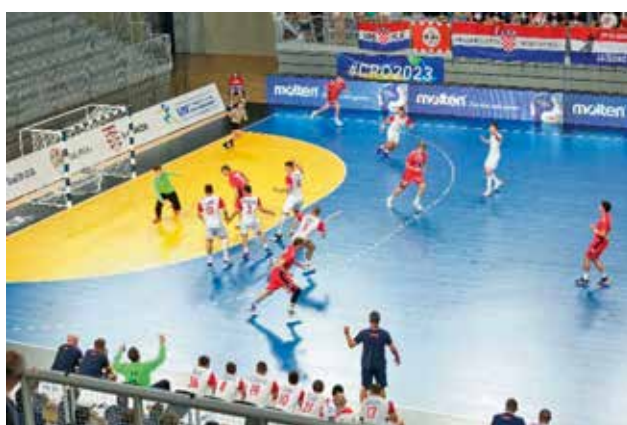
Serijska slika 2. Prvi i drugi branitelj desno prestržeta podaju med levim zunanjim napadalcem i levim krilom, ki je stekel ob črto vratarjevega prostora za hrbiti branilcev (četrtfinale: Hrvaška – Norveška)