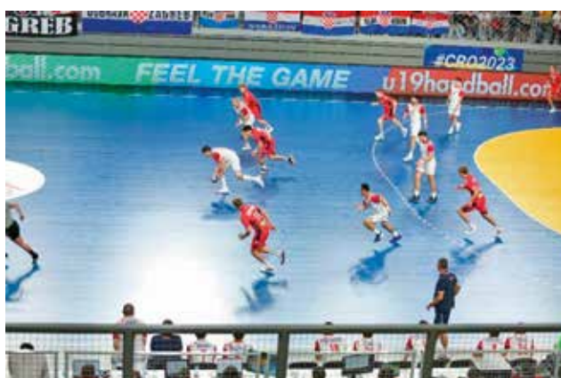
Serijska slika 4. Drugi branitelj levo odvzima žogu po nenatanni podaji med levim in srednjim zunanjim napadalcem (četrtfinale: Hrvaška – Norveška)