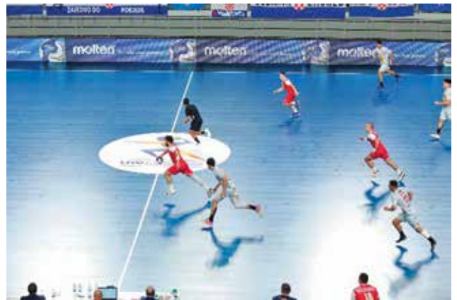
Serijska slika 7. Drugi desni branilec preštreže podajno med desnim in srednjim zunanjim napadalcem (polfinale: Hrvaška – Španija)