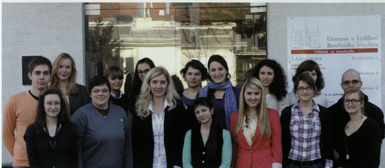
Udeleženci 1. Simpozija raziskovalne mreže Integratomics TIME 2012.

Glavna razlika je, da Univerza v Ljubljani skrbi le za akademski del študentovega življenja, ne pa tudi za druge vidike, ki so enako pomembni na poti do uspeha. Usklajevanje študijskih obveznosti in razvedrila sta glavni poti do uspeha. Vsi potrebujemo čas »off-work«, čas za kavo, pivo, za telovadbo, da poskrbimo za svoje fizično kot tudi mentalno zdravje. Tega se študentska organizacija in univerza tukaj