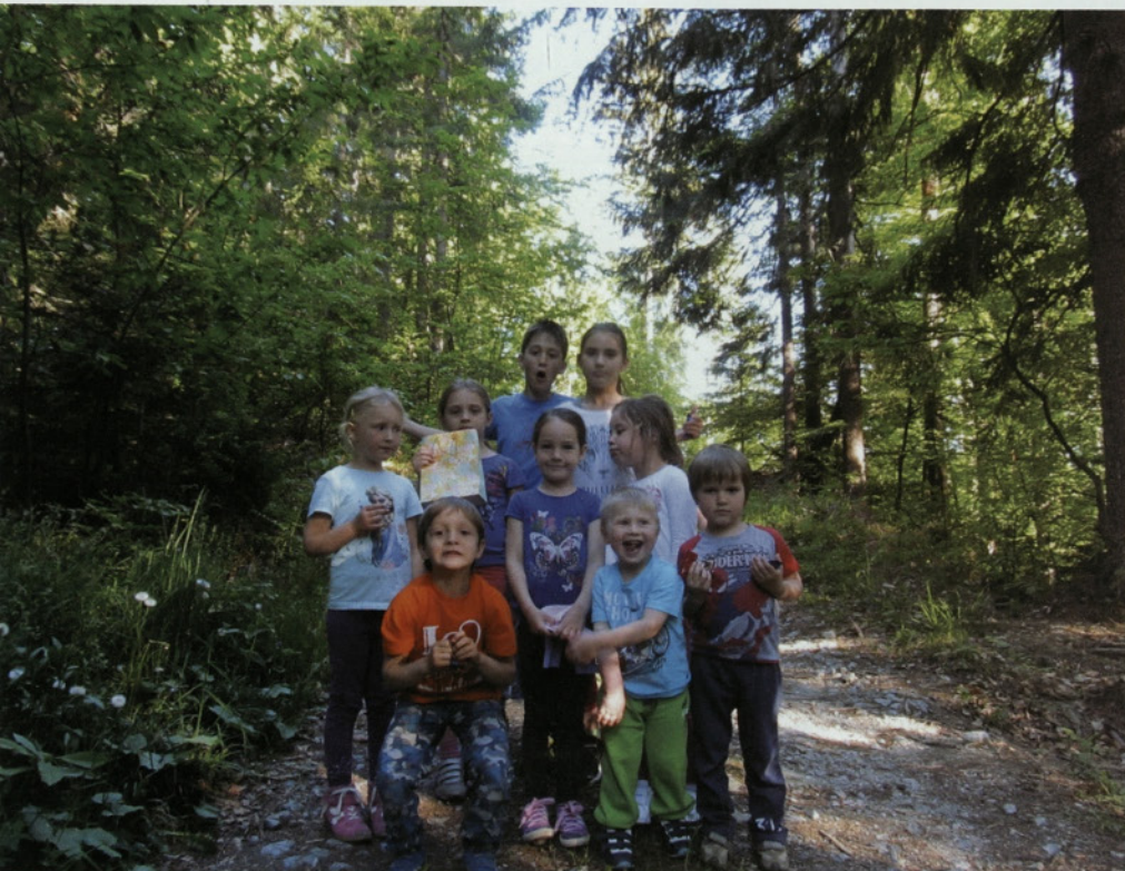
Otroci so iskali skriti zaklad po mavrični poti.

Vsako leto ob koncu sezone pripravijo zaključno srečanje, na katerem se še zadnjič v šolskem letu skupaj poveselejo otroci, starši in animatorji. Z združitvijo športne dejavnosti in dobre volje si polepšajo popoldne. Letos je zaključek športne vadbe potekal v četrtek, 7. maja 2015, na vsem dobro poznani lokaciji – pri REKS-u v Ravnah. Najprej so se otroci z vaditeljicama odpravili v lov na zaklad po mavrični poti med gozdnimi stezicami in na poti opravljali različne naloge. Uspešno opravljene naloge so jih pripeljale do skritega zaklada. Medtem so starši pripravili malico in poskrbeli za lakoto in žejo otrok, ko so se vrnili z iskanja zaklada. Sledilo je presenečenje, in sicer so jih obiskali člani Šaleškega folklornega društva Koleda. S plesom in glasbo so jim polepšali četrtkovo popoldne in poskrbeli, da so se tako otroci kot starši dobro razmigali.