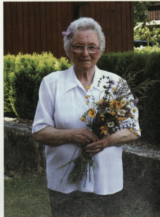
Videmškovo Emo so za rojstni dan pospremili v deveto desetletje življenja.