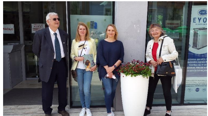
Slavo po uspešnem sestanku – tokrat brez mask

Dogovorili smo se, da takoj pristopimo k izvedbi projekta. EDL bo zagotovil lektoriran prevod besedila v esperanto, OKC pa ponudbo tiskarne in privoljenja avtoric besedila in ilustracij ter oblikovanja. Na osnovi ponudb bomo določili naklado in delitev stroškov oziroma knjig. Rok za izvedbo projekta je oktober 2021. O.K.