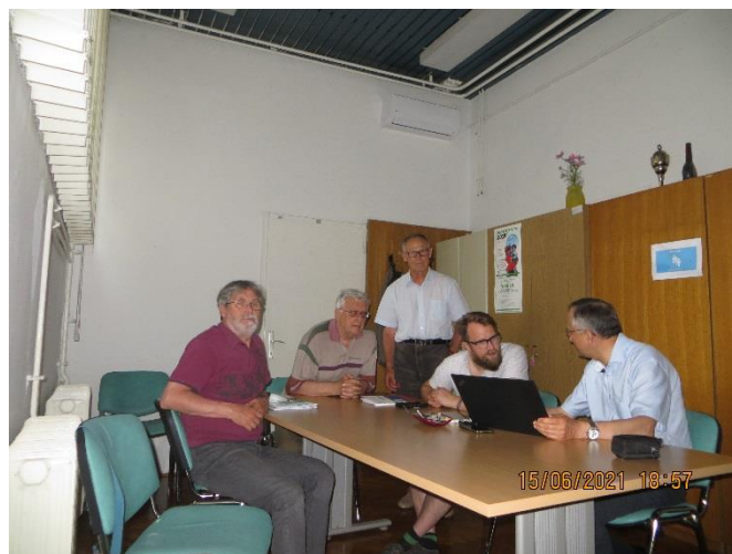
Paroliga vespero en Ljubljana

Paroligaj vesperoj en Ljubljana: en la klubejo de SIEL (Stefanova-strato 11) ĉiun 1-an kaj 3-an mardon en la monato je la 18-a horo. Ankaŭ dum la somero!