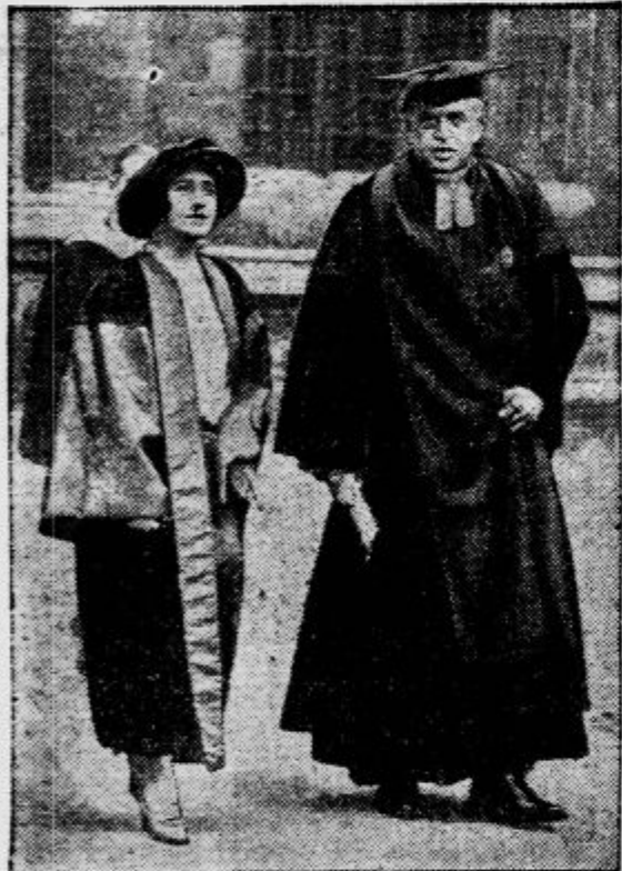
Med svečanimi srednjeveškimi ceremonijami je bila v Oxfordu promovirana yorska vojvodinja za doktorja državljanskega prava. Poleg nje rektor oxfordске univerze