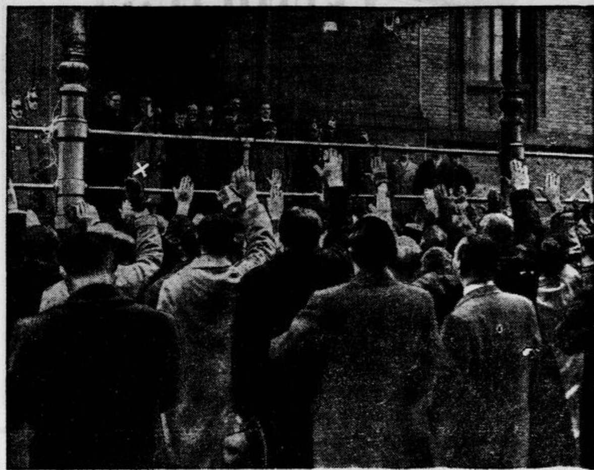
Nemški narodni socialisti pozdravljajo Grandija (X) s fašističnim pozdravom!