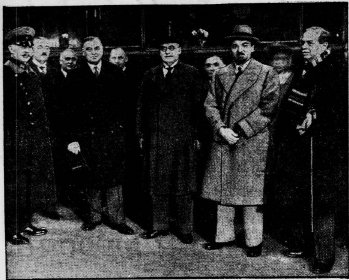
Od leve proti desni: državni tajnik Pfinder, državni tajnik Weissmann, državni kancelar dr. Brüning, minister Grandi in italijanski poslanik v Berlinu Orsini-Baroni