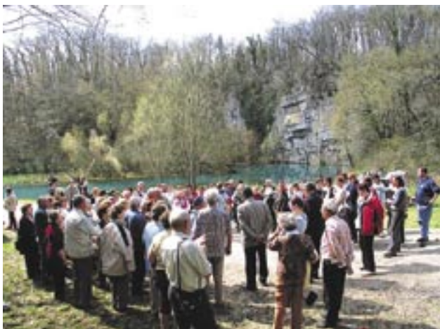
Slika 3: Obisk na posameznih lokacijah raste iz leta v leto - primer Izvir Krupe v občini Semič.