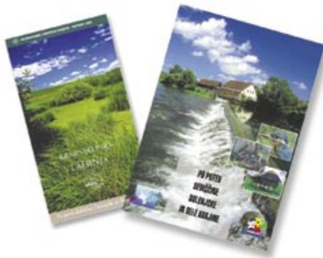
Slika 4: Promocijsko gradivo projekta je na voljo v šestih jezikih.