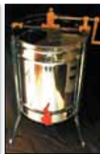
KAKOVOSTNA RSF- TOČILA AKCIJSKA CENA