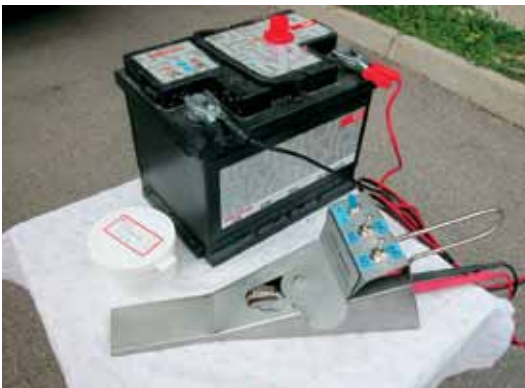
Naprava deluje na 12 V akumulator

Naprava je bila razvita kot pripomoček za zimsko zatiranje varoj tako, da lahko s sublimirano OK zadimimo notranjost panja. Pri tem nam AŽ-panjev ni treba odpirati od zadaj ali jemati satov iz panjev, pri nakladnih panjih pa ni treba dvigovati pokrovov. Odpiranje panjev je namreč zamudno delo, poleg tega pa lahko pri tem tudi preveč ohladimo čebele. Sublimiranje bi namreč potekalo z zunanje strani, in sicer skozi žrelo oziroma vhod v panj. S tem je tudi občutno zmanjšana možnost zastrupitve čebelarja z OK. Če bi se naprava morebiti izmaknila iz panja, pa bi se lahko, če se vsa kislina še ne bi izdila v panj, kadar koli odmaknili, saj ste zunaj oz. na prostem. Vsekakor je treba pri tem delu uporabljati ustrezno obrazno masko.