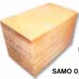
PREDELAVA VOSKA V SATNIKE SAMO 0,85 EUR/KG

SATNIKI: AŽ-VRTAN, LEPLJEN, ZBIT LR-STANDARD LR 2/3