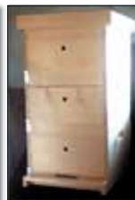
STANDARDNI LR-PANJ IN DVOTRETINJSKI LR-PANJ AKCIJSKA CENA