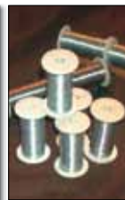
ŽICA ZA SATNIKE 250 g RSF 4,8 EUR 250 g CINK 2,5 EUR