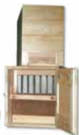
PRAŠILČEK AŽ 5-IN 7-SATNI