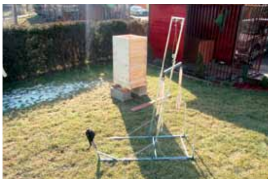
Razstavljeno dvigalo, pripravljeno za uporabo

Za izdelavo dvigala sem uporabil kovinsko konstrukcijo, vrvi, vodila in škripce. Dvigalo na škripec