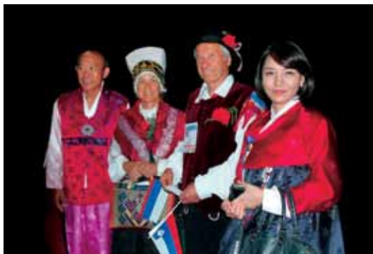
Organizacija svetovnega čebelarskega kongresa leta 2015 je v hudi konkurenci s Kitajsko pripadla Južni Koreji. Na sliki sta poleg dveh slovenskih tudi dva predstavnika te države v narodnih nošah.