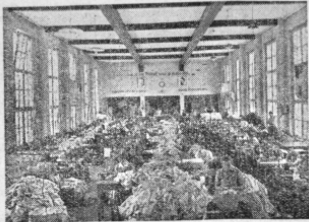
Šivalnica v »Topru« — na sliki je še stara ureditev, ki so jo sedaj opustili.

Za konec še nekaj misli. »Toper« je prvo podjetje v Celju, ki je v interesu znižanja stroškov proizvodnje in povišanja storilnosti dela zavrglo star način in sprejelo nov proizvodni sistem. Zvišanje proizvodnje za 18% v tako kratkem času in predvideno zvišanje do 24% pomeni zelo veliko za industrijsko podjetje. Morda je v Celju še več podjetij, kjer bi s temeljito analizo procesa dela našli mnogo napak? Pomislimo samo, da bi pri večini celjskih podjetij preureditev sistema dela povečala proizvodno zmogljivost za 20%, koliko bi to pripomoglo k dvigu živ-