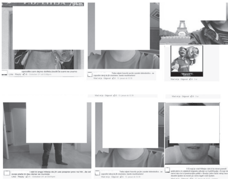
Slika 2: Primeri protiislamističnih izjav slovenskih uporabnikov Facebooka ob izbruhu t. i. begunske krize 2015.

Povezanost antisemitizma in islamofobije je epistemološka in politična (Renton in Gidley, 2017: 6), podobnost med antisemitskimi in protiislamističnimi viralnimi izjavami pa ne odpira zgolj prostora tezi, da je islamski begunec ali migrant danes reprezentiran kot novodobni Jud, ampak razpira tudi številna druga konceptualna in spoznavna vprašanja. Eno od njih je preprosto: sta antisemitizem in protiislamizem zgolj obliki nečesa, kar je v svojem temelju generično predhodno obema, sta morda zgolj variaciji iste vrste sodobnega rasizma v dveh uprimeritvah? Je krepitev protiislamizma v tej perspektivi dokaz vnovične moči in zagona fašizma, in to takšnega, ki se generira od spodaj navzgor, ne nujno s pomočjo političnih vodij? Eden izmed možnih strašljivih zaključkov primerjalne analize bi lahko bil, da protiislamizem danes prevzema vlogo zgodovinskega antisemitizma, ga širi, afirmira in končno normalizira. Glede na to, da se sovražni govor v Sloveniji zaradi zakonodajnih omejitev in tožilskih interpretacijskih nesporazumov skoraj ne preganja, nobena od zgoraj navedenih izjav ni bila kazensko preganjana kot izraz nestrpnosti, zato je v javnem prostoru obstala kot ne-sankcionirana in s tem normalizirana. Sodobni islamofobi in protiislamisti, kot smo videli, so »navadni ljudje« iz množice in ne zgolj predstavniki