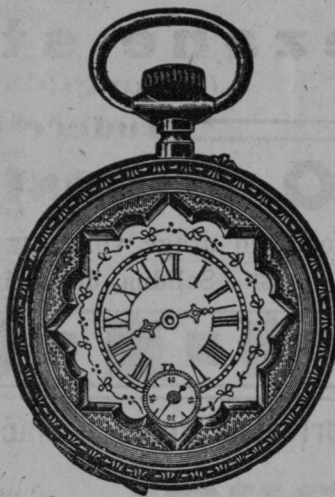
Srebrna ura 5:50, 6:—, 6:50 gld. Anker s 15 kamni 8 do 12 gld.