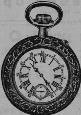
Srebrna ura 4:80, 5:50, 6:— gld. Anker ure od 7 do 12 gld. Jamči se 3 leta.