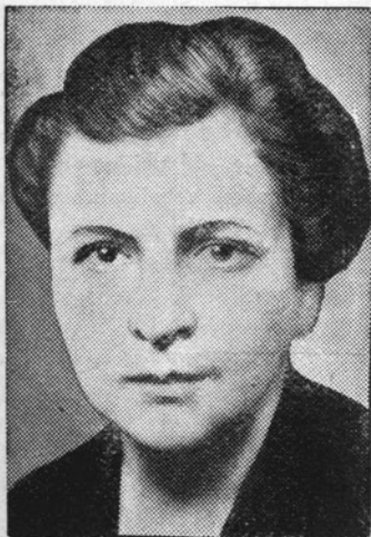
Mis Perkins , do nedavnega voditeljica državnega delovnega urada v Newyorku, je kot prva ženska prevzela ministrstvo za delo.

S tolažbo v srcu vstanem, zazrem še enkrat ji v oči. Povsod Brezmadežna me vodi, Ti moja si, jaz verna Tvoja hči.