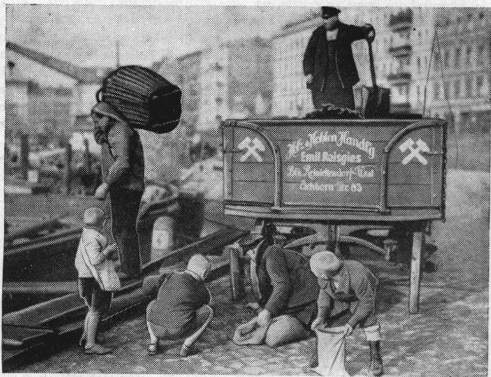
Otroci pobirajo premog... Kolikokrat smo jih videli! Hvala Bogu, te žalostne slike ne bo več, ker je prišla pomlad!

Kot mati si zaživela. Sveta ljubezen ti je nanovo izoblikovala dušo. In ta duša je sijala v očeh, ta duša se je smejala na licih. Duša, ki je bila polna ljubezni... Šel sem. Črešnja ob vrtu je dehtela. Pomlad in življenje.